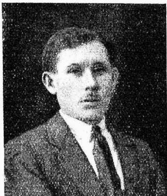
Sm. TAMBERK Lasti maha. Järele jäi kaks wäikest last