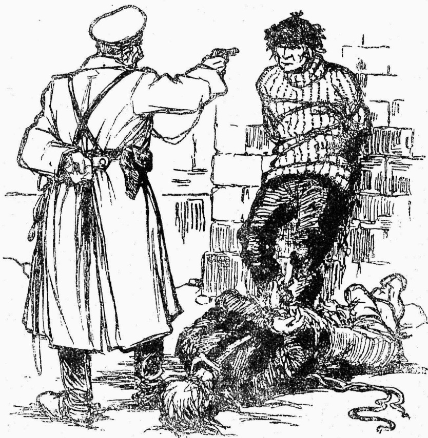
KODANLINE IRMUWALITSUS SOOMES A. 1918

Wastutaw toimetaja: H. Pöögelmann. Väljaandja: Kommunistlise Internat- ::: sionaali Eesti seksioon. Peterburis, Komissaarowskaja 11, k. 18. :::