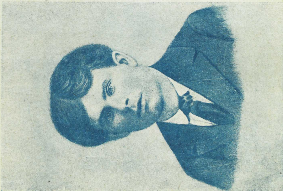
Joonistus rikutud miniatüür-päewapildi järel. Originaalil puudus muuseas juustcosa, mida kunstnik, kes s. Kreuksi isiklikult ei tunne, waleste aimas :::