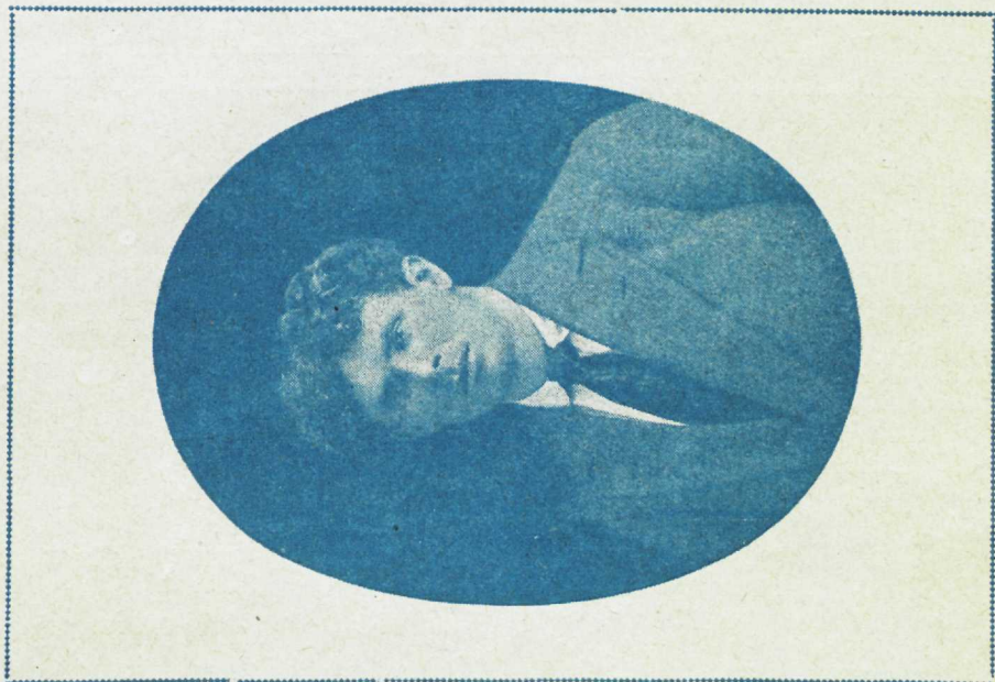
Päewapiltline rikkumata originaal seitsamast ajast wõi üleswõttest, mille katkete järele eelmine joonistus on tehtud. See pilt saadeti meile iljem Eestist.