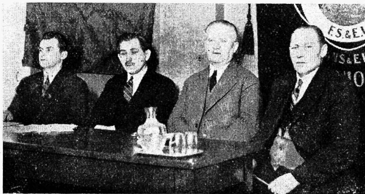
Soome merimeeste ja kütjate unioni 1. kongressilt 10. I 32.

Nagu Norraski, sündis ka Saksa kaugesõidu merimeestel suurem palgakärpimine peale sisesõidu merimeeste. Saksa reederid nõudsid 25% madruste ja 40% ohvitseride palkade kärpimist, kolmevahi-süsteemi kaota-