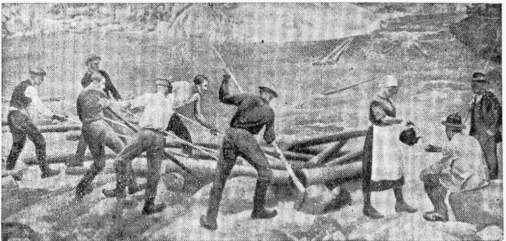
Seinamaal Rahvusvahelise tööbüroo hoone eesruumis, soomlaselt Pekka Halonen'ilt.

ühing asutamistest peale asus, oli äärmiselt eba- soodne, kuid ka see lahendus sellega, et 27. juulil 1927. a. otsustati ülekolida W. Pärnu mnt. nr. 31. C. T. Keskliidu ruumidesse. Ka jaadi aasta lõpu poole juletud ametiühingu warandused kätte. Siit peale arenes võimalus suurema eduga tööle ajuda. Töötati välja ühingu asjaajamise ja usaldusmeeeste kodukord, ka asutati matmise toe- tamise kasja, wõeti elawalt osa „Keskliidu“ ja „Tallinna Ametiühingute Kesknõukogu“ asutami- sest ja põhikirjade wäljatöötamisest. Ühingu wä- stu kaswas usaldus tööliste keskel filmnähtawalt. Liikmete arw tõusis järjekindlalt, ka suurenesid ühingu oma kapitalid. Et ühing liikmetele saaks peale moraalse toetuse ka rahalist toetust wõimal- dada, pandi peardõhku ühingu sissetulekute tõstmis-