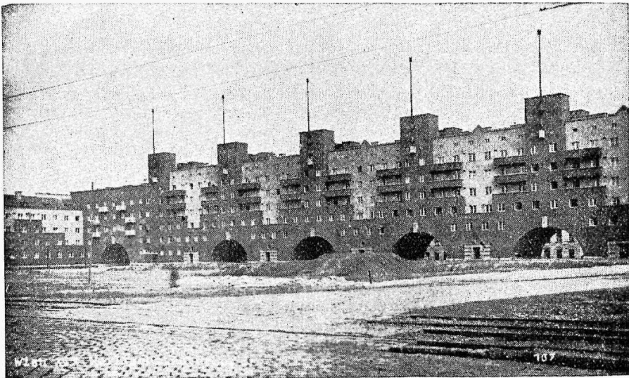
Viini linna poolt tööliste ehitatud elumajad.

Samal põhjusel on ka wäljaspool Euroopa maade juhtes siin ja seal ifka jälle üles tekkinud grupeerimise idee. (Rahvuswahelise transporttöölise föderatsioon püüab