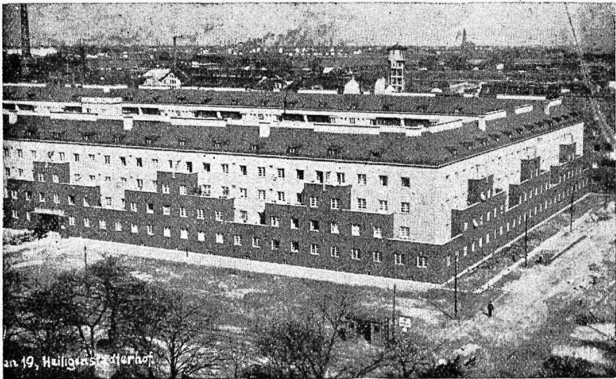
Viini linna poolt töölistele ehitatud elumajad.

Oleme jõudnud Ramennoostromski prospektilt ligi Troitski sillani. Gespool on rahwas walgunud laiali. Olen sattunud pea esimestesse ridadesse. Umbes 200 jammu