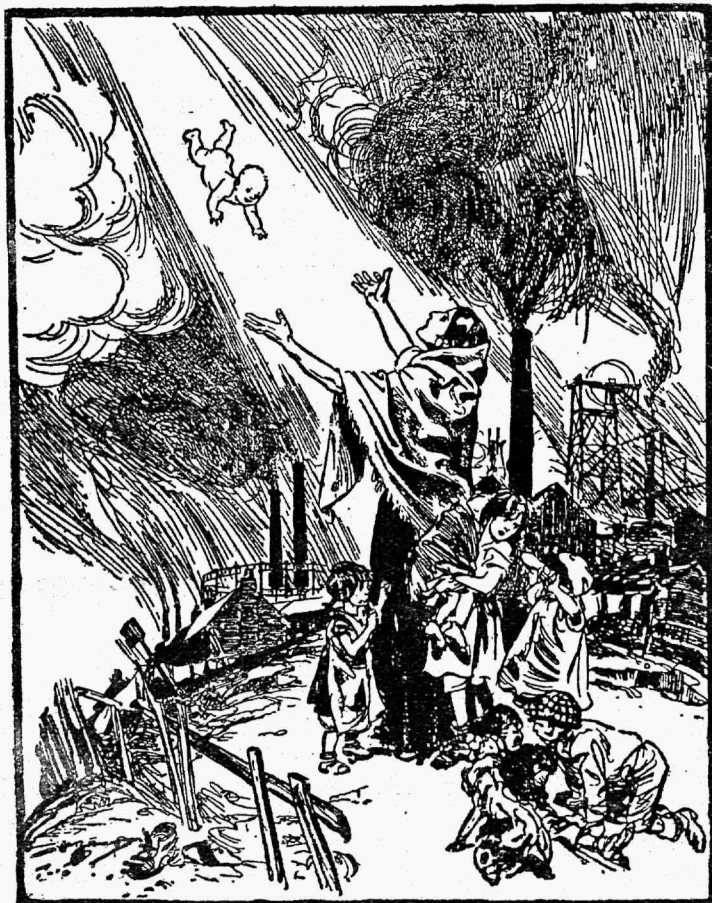
Emal, kas Kristus toob meile leiba?!

Sisukord: 1) Meie jõulud. 2) XIII rahvusvaheline töökonverents. 3) Külalisi kolmelt maalt. 4) Rahvusvahelise Ametiühingulise Liidu juhatus koosolek 21. ja 22. nov. 1929 a. 5) Tööstuste juhtimise ümberkorraldamine Wenemaal. 6) Kaitsetollid ja palgakõrgendus. 7) Nõukogude-Wenemaal puhkepäewad kaotatud. 8) Rootsi ametiühingute keskliit 1928 a. 9) Wabad ametiühingud ja Kommunistlik ametiühingute kongress. 10) Meie jõulukülaline. 11) Kõigi silmad on pöördud Austriale. 12) Sotsiaalsest töödigusest. 13) Sotsiaalne ümberkorraldus. 14) Punaste ametiühingute internatsionaali telgitagustest. 15) Näljahädad keskajal. 16) Teateid ametiühingutest.