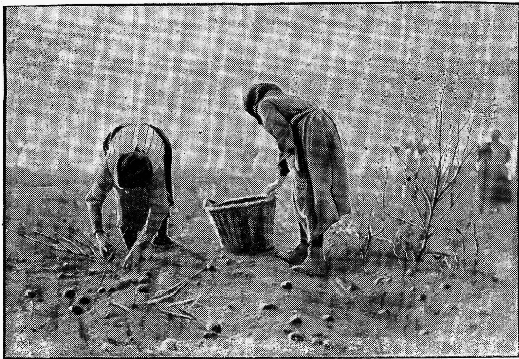
Waesed otsimas hilissügisel rikaste wäljadele mahajäänud kartulaid.

Töövõigus annaks wähe kasu, kui tööd ei tajutaks õiglase tasuga. Wana kapitalistlik arusaamine lähtus sellest, et waba võitlus tööliste eneste seas kindlustab igale ihele õiglase tasu, võitlust arvestades iga tööline arendawat kah ühteaegu omi jõude wiimase võimaluseni, mis jällegi olewat kogu rahwamajanduse huvides. Selle n. n. wabameelse majanduswaatega arwati ühtlasi õigustada võivat kah töölistkonna vastu sihituid koalitsioonikeeldu. Ent järease seifukoha wale selgub tohe, kui palgaküsimust waadelda fot-