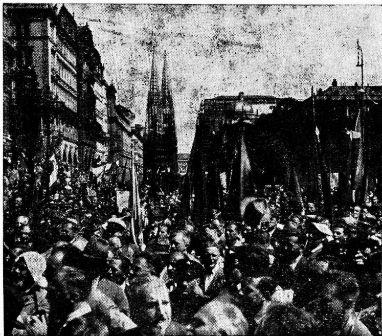
Sotsialistliku noorpõlve rahvusvahelised pidustused Viinis