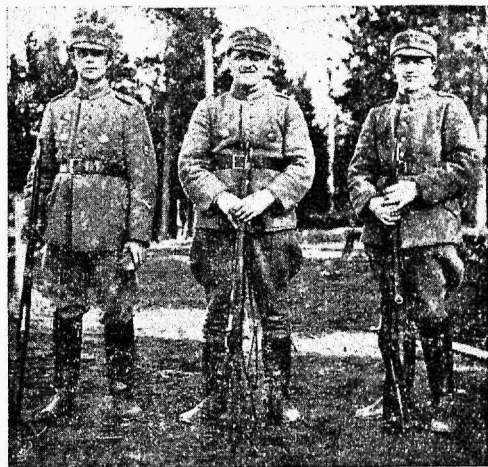
Kolm venda Mikkola't, kõik kurtummad — kaitseliitlased.

Porvoos rootsikeelne kõnelemis-, kirjutus- ja viiplemisskool,*) asutatud 1. 10. 1846. Juhat. Emil Quarnström, aadress Porvoo.