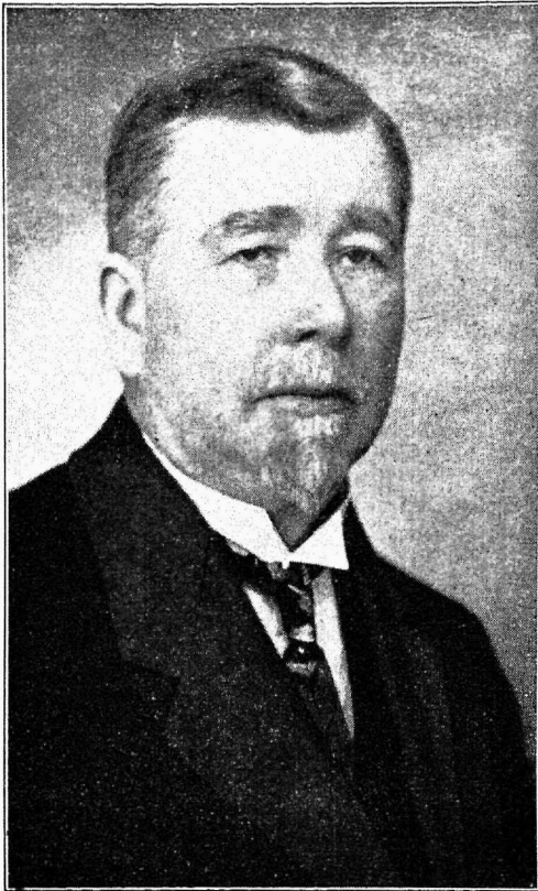
Dir. M. Laamann

heahtlikkuse juures üle sellega, et tema algatusel võimaldas A.-S. Viljandi Linavabrik uuele kassale laenu 350 rubla suuruses, mis-suguse laenu ta hiljem kustutas sama M. Laamanni ettepanekul. Selle kõige juures on veel teada, et uute kassade asutamist ei pandud mitte isikute peale, kes ise uue seaduse maksmahakkamist ei pooldanud, vaid seaduse elluviijaiks määrati ikkagi isikud, kes suhtusid uuele üritusele heatahtlikult. Säa-rasele nõudele vastas ka dir. M. Laamann, mispärast teda leiamegi praeguse haigekassa asutajana. Veel tuleb märkida, et uuel kas-sal ei olnud võimalusi muretseta endale korterit jne. Selle küsimuse lahendas jällegi kassa asutaja sellega, et ta võimaldas kassa-le prii korteri, kütte kui ka valgustuse A.-S. Viljandi Linavabriku ruumides. Selle läbi kokkuhoitud summased saadi tarvitada kassa-liikmete avitamiseks. Ka meenuvad hilise-mad ajad, s. o. ajad, kus kassa tegevuse lai-nemise läbi 1931. a. oldi sunnitud võtma oma korter ja kus vahest ei olnud võimalik saada üht kui teist, mis kassa tegevuses oli tarvi-line. Nii puudusid ühel talvel Viljandi tu-rult küttepuud mõnd aega. Selle all kannat-s ka haigekassa. Et küttekriisi lahenda-da, pöördus käesolevate ridade kirjutaja jäl-legi M. Laamanni poole vastava palvega, ku-na A.-S. Viljandi Linavabrikul olid puud val-mis muretsetud. Vastava jutu ära kuulanud