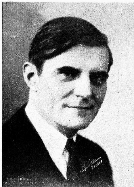
JOHN WINANT, rahvusvahelise tööbüroo direktor, alates 1. jaanuarist 1939. a.

Päevakorras olevate küsimuste kohta oli oma seisukohad võtnud Rahvusvaheline Kutseühingute Liit (RKL), kelle konverents peeti märkuus Oslos. Need seisukohad tehti RKL sekretariaadi poolt teatavaks töökonverentsile töolisgruupile, mille eelkoosolekust päev enne töökonverentsi algust võttis osa ka