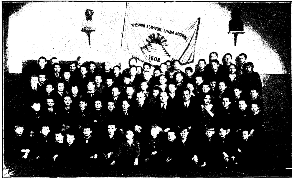
Tallinna linna I algkooli ENPR ja Lootusring „Edu“ 24. nov. 1933.

Kord nädalas, kesknädala õhtuti kella 17—19 on klubiõhtud, kus kõik soovijad kogunevad omavahelisteks tubasteks mängudeks või salga töödeks. Mänge tuuakse kodunt ja kasutatakse siis rühmades. Koolil on koroon. Klubiõhtuil on kasutada ajakirjad: „Õpilas-