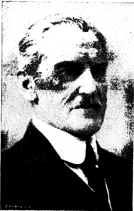
Prof. R. Kajanus,