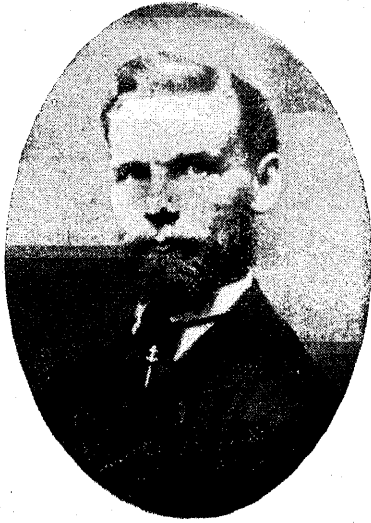
Esimene „Estoonia“ koorijuhataja TREU 1865. a.

valia", kus muu seas ka eestikeelseid laule lauldi. See selts muudeti aga lühikese tegevusaja järele Kaarli kiriku kooriks, mis pärast osa liikmeid sellest lahkus ja otsustas asutada uue seltsi. Uue seltsi