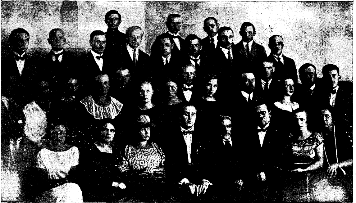
Lauljate Liidu esimene koorijuhtide nädal haridusministeeriumi suvekursuste juures 4.—9. aug. 1924. a.