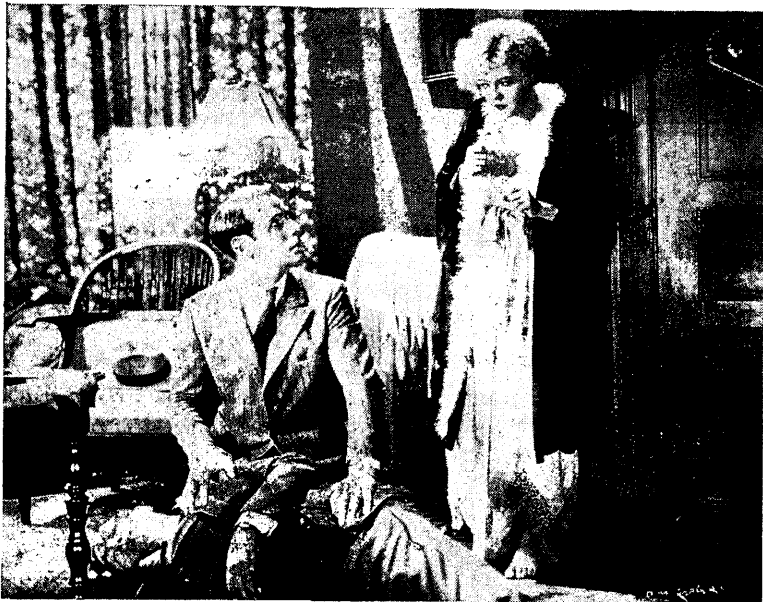
Viktor Varkoni ja Phyllis Haver filmis „Chicago“.

Võime tänada taevast, et me pole ohvitserid. Kui meie — seda juhtub — abiellume äiapapa rahaga, siis on see meie oma soov ja tahtmine ning võime talitada selle rahaga oma äranäge-