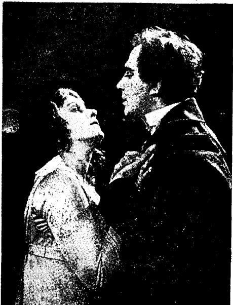
Greta Garbo ja Lars Hanson filmis „Gösta Berling“.

Nii oleks üldjoontes ülevaade noist lihastest, mis toimivad näo miimikas. Üksikute miimiliste ilmete arutamisel puudutame neid veel. Nüüd edasi.