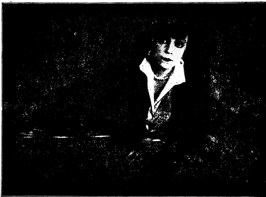
Asta Nielsen filmis „Tänava tragöödia“.

Kui olete jõudnud tõsisele otsusele, et tung filmile on aus, otsekohene kunstivaimustus, siis võib proovida end — fotograafiliselt. Kuidas ma mõjun fotograafiliselt? — Sest päänärve on kinokunstil fotograafiline mõjuvus. Kas mul on nägu, millist nähes ei unustata? Millised hääd ja vead on näol ja kehal? — Olete veendunud, et sobite vastavatele osadele, tuleb anda vastust