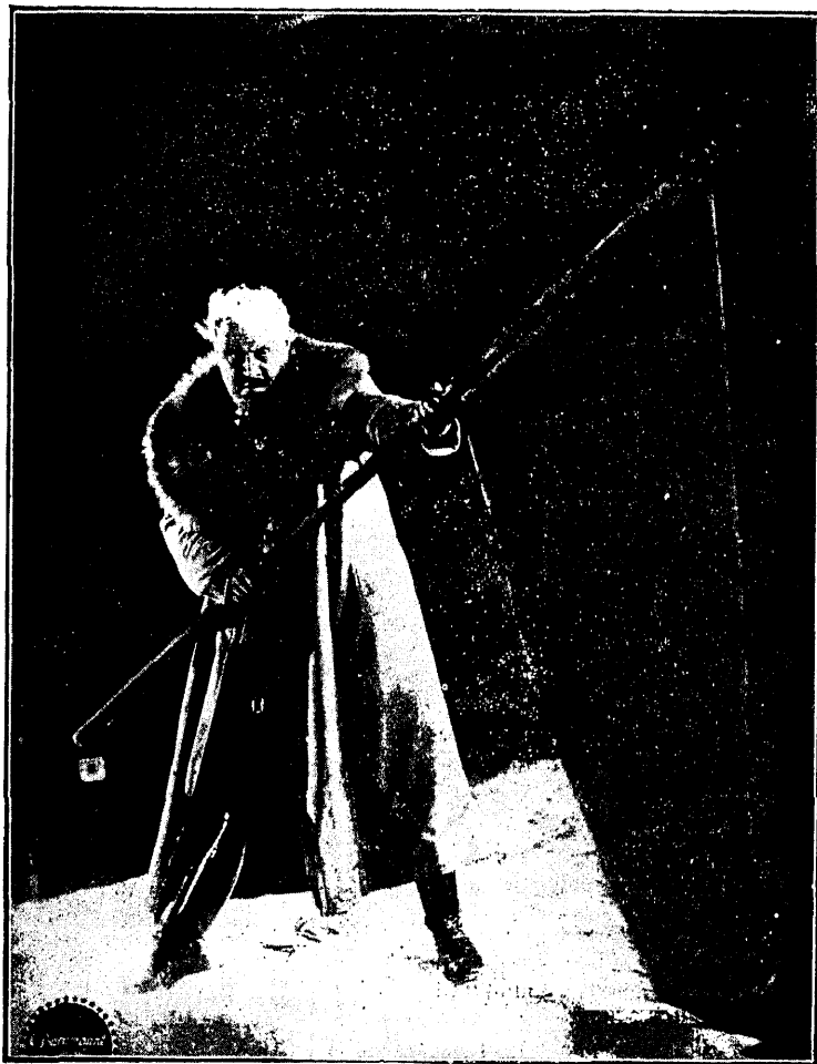
Emil Jannings „Paramount“-filmis „Tema viimne käsklus“.

Millest olete huvitatud? Kirjutage: Tallinn, Vene tän. 4. Toimetus vastab.