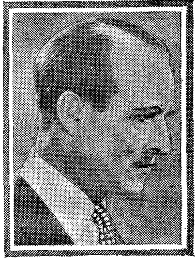
H. B. WARNER

Kinoline nõuab päämiselt piltsündmustikku. Ta nõuab liigutust, vaheldust, põnevust ja ilu, asju, mida osutab pilt. Kõla on hää täiendus, aga esikohale ta ei või kunagi pääseda. Ta võib olla oivalisena abina filmis efekti tõstmiseks ümbruse elustamises. Sest kõla, heli, kõra tõstavad filmi haaravust, mõjudes dramaatilistel momentidel, kus paistab, et näitelava ise peaks karjastama, et rõhutada täies määras dramaatilist eelkäiku. Aga et saavutada pilt ja kõlamõjule kunstiline harmoonia, sellest on veel liig vara kõnelda, ehkki Ameerikas on juba ligi tuhandeis kinoteatris vastavad tehnilised sisse-