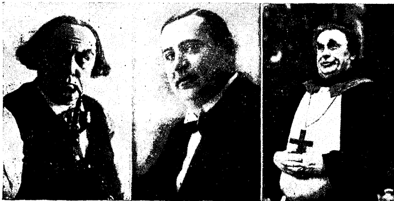
A. Kitzberg'i „Kauka Jumal'as“ Mogri Mardi os.