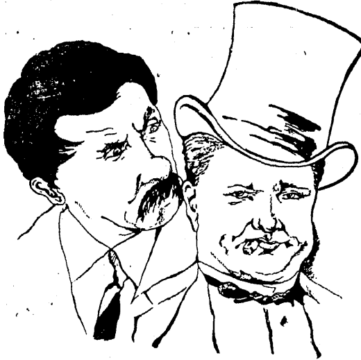
PAT ja PATASHON oma juubelifilmis „FILMIKANGELASED“.

Noormehega on ta juba tsirkuses klounina ja „kondivõnnjana“. Siit ta saabus filmi Patashonina.