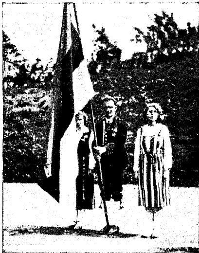
Eesti lipp peoplatsil.

käsitöö ja ühelt poolt, taotles samu sihte, ja A. Meikop, kes annetas ÜENÜ rinnamärgi mitmele soome noorsoo silmapaistvamale tegelasele. Liivi esitaja seminarist P. Damberg tervitas soomlasi väikese liivi rahva poolt. See kaunis ja meesööbiv õhtu lõppis eesti ja soome ühise hümni, alles kell 2 öösel, ning ühes sellega lõppesid suured pidustused, milliseid ei kordu nii pea.