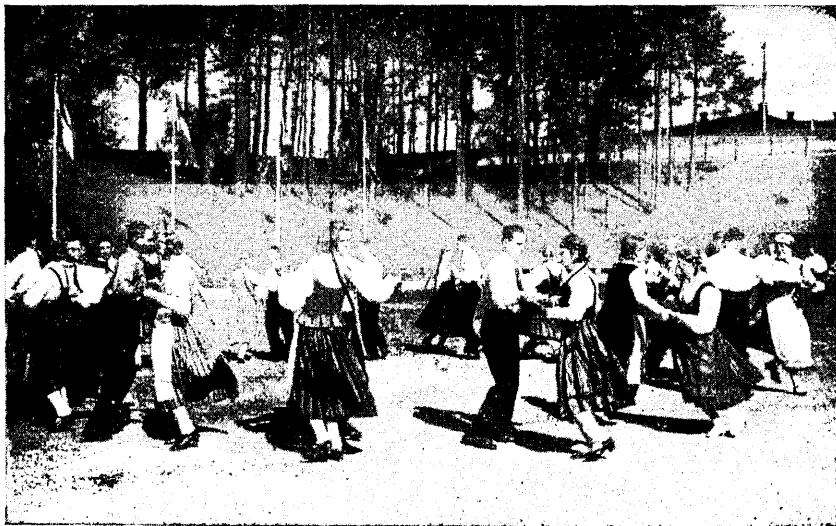
Soome Noorsoo Liidu juubelpidustusilt.

Et soome noorusliikumise aluskivid olid tugevad, sellest kõnelevad veelgi viljeldavad vanad traditsioonid. Asutatud maale ja