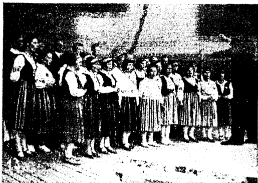
ÜENÜTO lauljad Soome pidustusil eesti laulu esitamas.

Noorsooliikumise päämine glesanne on võimaldada igale osavõtjale kasvada vaimliselt, hingeliselt ja keha'iselt seevõrra tugevaks, et ollakse hiljem võimeline omal jõul elust läbi tungima, oma teel pysima ja ymbrust looma, see asemel, et olla selle mängukanne.