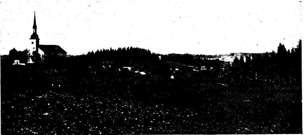
Otepää kiriku ümbrus.

Istunud murule, rääkis vend esiteks, milline olnud Linnamägi sakslaste Eestisse tungimise ajal: mäeküljed hoopis järsumad, lahtine vesi mäe ümber, ülestõste-