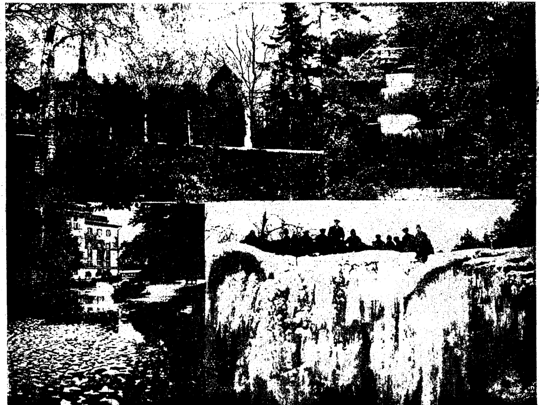
Neli aastaaega. 1. Esimesi lehti kevadel Harjumäel, Tallinnas. 2. Keskswine Palmse, Sepsa sild. 3. Sügisene pori Tallinnas. Pilt sobiks ka tänavusele talvele. 4. Käosalu noorsoolased Keila-Joal talvel, millist tänavu vaid unistada võime.