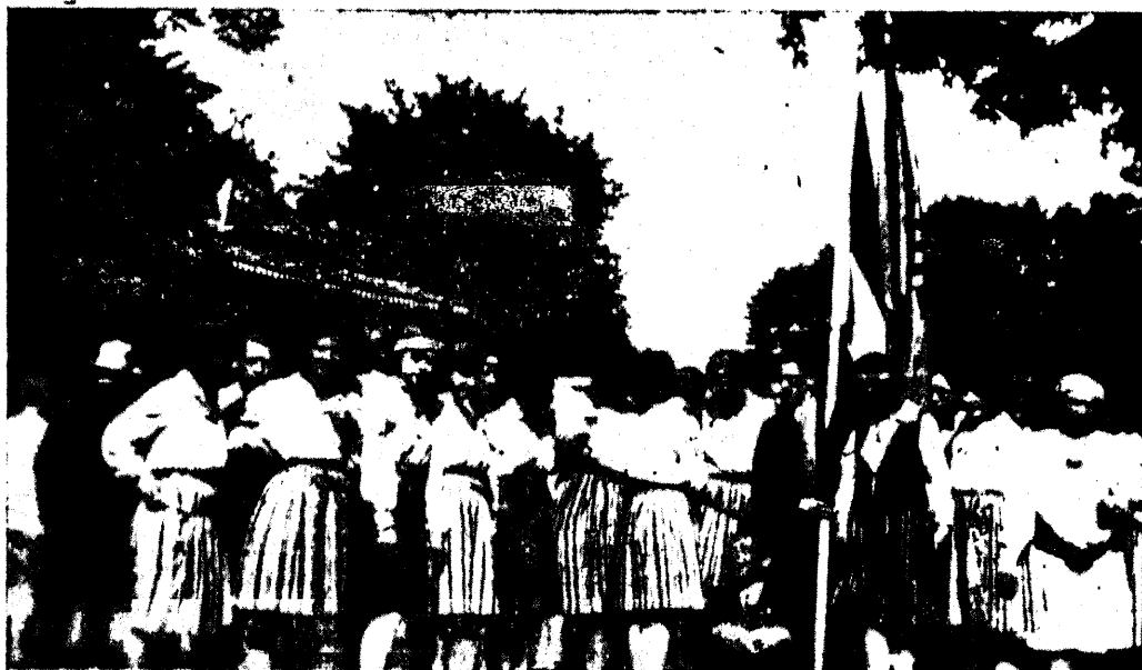
Läti noorsoolased-tantsitarid ÜENÜ juubelpidustustel.

SISU: Eesti noorsele — Rolf Gardiner. ÜENÜ juubelpidustused. Need päevad ei unune ilal — V. Mustel. Pidustuste kõver peegel — Torgla. Opiringidest — ILS. Tähepanu loomakaitsel — dk. Noored ja kirik — S. Jutustusi osakondest. Noorsoo töö mailt. Juubelpidustuste spordivõistlused. Pilte noorsoo tegevusest Kuulatusi j.m.