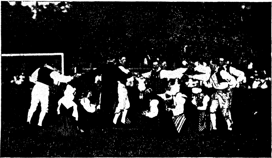
Rootsi rahvustantsude selts „Appel“ tantsude ettekandel.