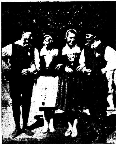
Juubelpidustusilt. Tegelikke sõprussidemeid.

Kõnele järgnes hümn, millele järgnes eeskava. Üldkoori ettekanded hra. Kase-metsa juhatusel, mida sama andumusega kuulatigi kui ette kanti. Järgnesid üldtantsurühma ettekanded. Kirev, ilusais tantsu rütmilisel ning kooskõlalisel ette-