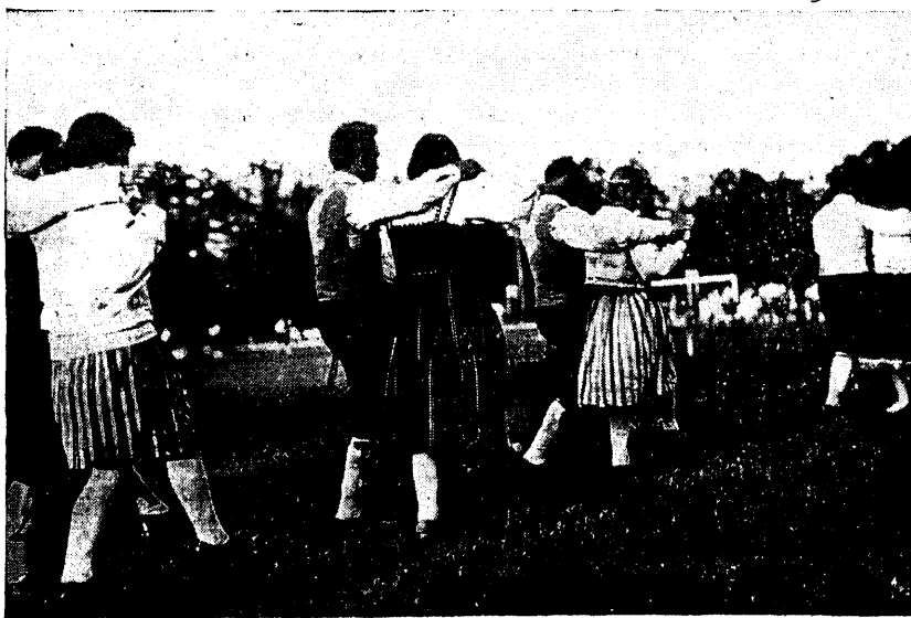
Osa üldrühma eesti tantsude ettekandel.