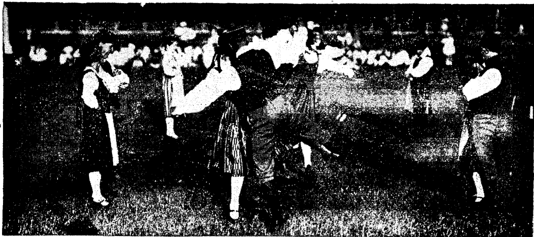
Soome noorsoolased omi rahvustantse ettekandmas.