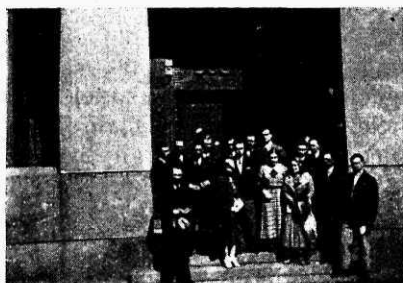
Soome ekskursioonist osavõtjad „Suomi“ trepil.

Esindajate toas torkas silma suur seinatahvel, kuhu inspektor märgib iga üksiku kaastöölise nädala- ja kuuproduktiooni. Sellega luuakse võistlus üksikute esindajate vahel, mis, nagu näi-