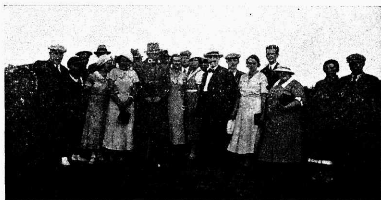
Petseri suvipäevast osavõtjad Vene piiril.