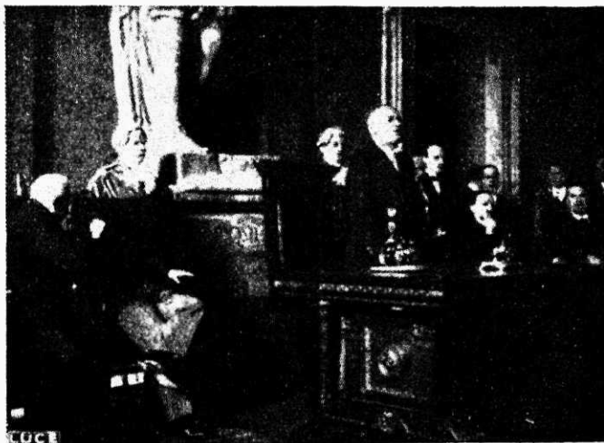
Mussolini avab kongressi Julius Caesari saalis.

See küsimus on viimasel ajal saanud eriti aktuaalseks, kuna kindlustust vajatakse mitte üksi surma, vaid ka töövõimetuse puhuks. Invaliidsuse lisakindlustus on aga mõnel pool andnud seltsi-