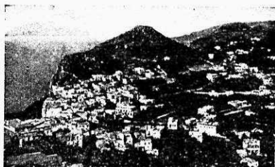
Capri saar Vesuuviga tagaplaanil.

maas ning nii mõnigi neist laulab aariaid itaalia oopereist. See kõik ei ole keelatud. Markuse plats oma rohkearvuliste tuidega, kuulsate kolonnide ja kellaga ning doodžide palee näevad tegelikult hoopis kaunimad välja kui oleme harjunud neid kinopiltide järgi ette kujutama. Saksa keelega pole Itaalias väga palju peale hakata, küll aga tuntakse prantsuse ja inglise keeli võrdlemisi