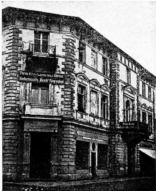
KINDLUSTUSSELTS „EESTI“ POOLT ÄSJA OMANDATUD MAJA PÄRNUS.

Juulikuu lõpul omandas meie selts Pärnus Rütli tän. nr. 28 Uttopärti pärijatelt kolmekordse kivi-maja, mille ostuhind kogu ulatuses seltsi poolt kohtu-deposiiti makstud. Maja omandamine sündis vabade kapitalide mahutamise si-higa. Ostetud kinnisvara on seltsil arvult neljas, kuna juba varem seltsil Tartus 2 ning Rakveres 1 kivimaja oli.