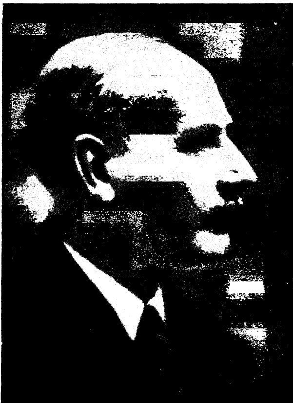
Peaminister K. EENPALU

mõtteks, et riigielu saaks kindlakäeliselt juhtida, et valitsuse seljataga seisaks parlamendi enamik. Praegusel K. Eenpalu valitsusel on parlamendis veel märksa suuremgi enamik, kui omal ajal soovitud „51”. See võimaldab kaugemaulatuseliku kavaga töötada, ilma et valitsusel tarvitseks arvestada parlamendist tulevaid pisisoove või nendest sõltuvaks teha oma saatust. Siin on tõsisel riigimehelikkusel nüüd hea võimalus näidata oma võimeid. Peaminister K. Eenpalult, tema jõudes üle 50. eluaasta läve, seistes oma elu paremais aastais, võib eelduste kohaselt oodata, et meie riigielu areng, niipalju kui see oleneb vabariigi valitsusest ja selle juhust, läheb edurada. K. Eenpalu idealistlikud püüded, mis muudes muudatustes ja elurägastikus ikkagi endiseks jäänud, peaksid meile kindlustama demokraatliku korra peatse lõpliku tagasituleku — elukoolist läbikäinuna, ümberhinnatuna ja küpsemana endisest. Selle sooviga võiksime lõpetada ja saata hilinenud tervitused härra peaministrile.