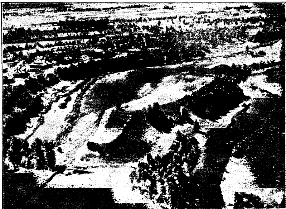
Iru linnus lennukilt.