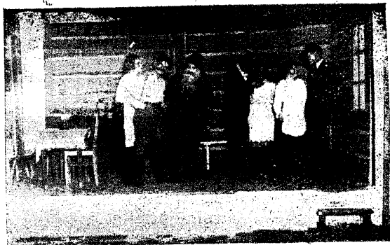
Pilt Audru kursuse lõpupeol ettekantud „Püve talust“.

See oleks meie väärtuslikumatest algupäranditest. Järgnevad väärtuslikumad tõlked, neist oleks nimetada: Molière „Arst vastu tahtmist“ 5 korda, H. Ibsen „Ehitaja Solnes“ 1 kord, S. Carricki „Naine, kes tappis“ 1 kord, Montague Glassi „Potasch ja Perlmutter“ 1 kord, Maeterlincki „Ode Beatrice“ 1 kord, Järvilouma „Põhjalased“ 1 kord, Anzengruberi „Enese-