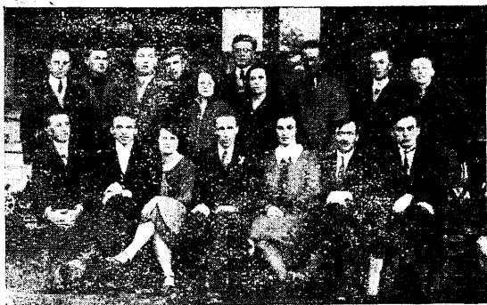
Eesti Raamatukoguhoidjate Ühingu raamatukogunduse kursused Tartus, 25. veebruarist — 5. märtsini 1929. Pildil kursused ühes lektoriga. Pildil puudub osa kuulajaid.

Väljaspoolt Tartut oli 4. Kursused kestsid 9 päeva. Iga päev peeti 3 loengut, ka pühapäevane päev oli tervelt rakendatud. Tutvuti ka „Postimehe“ trükikojaga, Ülikooli ja arhiiv-raamatukoguga ja Riigi arhiiviga. Loengud peeti ühes praktiliste harjutustega. Käsitati järgmisi aineid: Bibliograafia. Kirja ja raamatu ajalugu. Raamatukogude ajalugu ja liigid. Raamatukoguhoidja, tema ülesanded ja kutseharidus. Avalikkude raamatukogude seadus. Raamatute valik. Inventeerimine. Liigitamine. Kataloogimine. Nimestikud. Raamatukogu ruumid ja sisseseaded. Avalikud riiulid. Laentamine ja läbikäimine lugejatega. Arvustik ja asjaajamine. Raamatukogu ja vabaharidustöö.