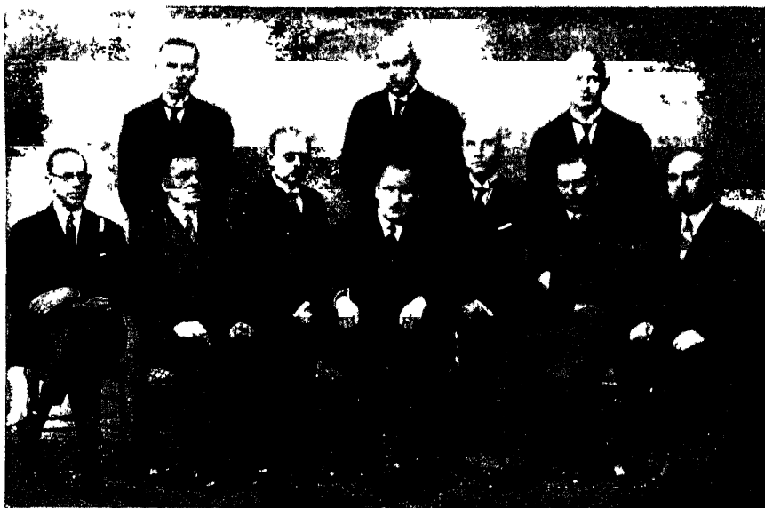
Eesti Panga nõukogu 1929. a.

Hiljem leiti mittekallismetallid ja märgati neil omadusi, mis tegid nad relvade ja tööriistade toormaterjalina palju väärtuslikumaks seni tarvitatud kivist. Esimene metall, mida tarvitati seks otstarbeks, oli vask. Alguses teda tarvitati puhtalt, kuid hiljem segati teda tinaga pronksiks, mis oli palju kõvem puhtast vasest. Vanemaid tuntud vase leiupaiku on Kuproose saar, millest vask on saanud oma ladinakeelse nimegi