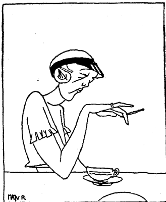
Naistudeng käib korralikult kohvikus, räägib naisõigusest ja loodab sel semestril kindlasti mehele saada.