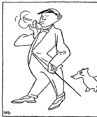
Mis rääkida päevamuredest! Eks see kraanide sulgumine ole mõjund siia, pole kuhugile ruttu, ka kõrtsi mitte; tuleb igavuses vistist õppima hakata.