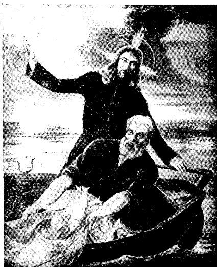
Altartavlan i L. Rågå kapell.

Och att gömma sig själv hos Kristus betyder, att tyngdpunkten i mitt liv flyttas från mig själv till honom, så att han får ansvara för mig inför Gud, inför människor och inför mitt