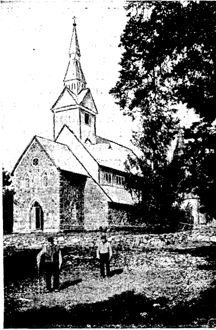
Runö nya kyrka.