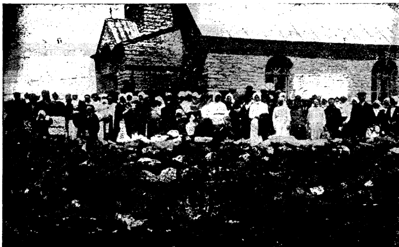
Menigheten samlad utanför St. Rågö kapell.

Middagen avslutades med sylt och klenät, ett slags västgötskt julbröd. Far och Mor gingo sedan ut för att önska god jul hos kusken, arrendatorn och torparna; och julgåvor torde därvid nog också ha förekommit.