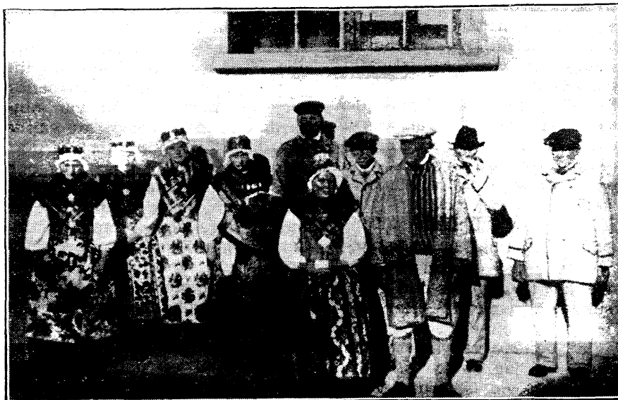
Runöbor utanför Svenska kyrhan i Reval.

Myndigheten och kraften i en kristen människas liv är i själva verket helt besläktad med den självförgätenhet, varom nyss talades. Just därför att människan