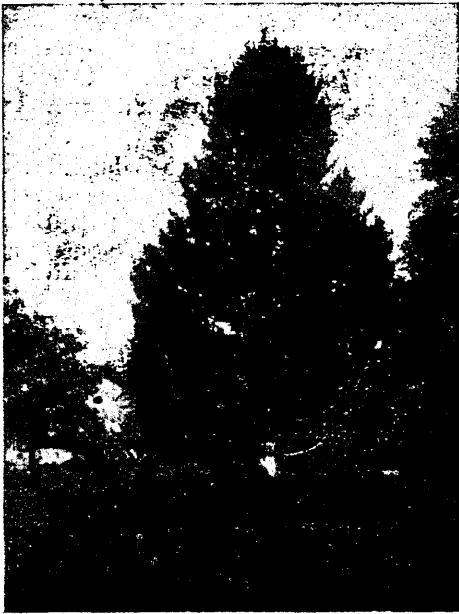
Pinus strobus L., Heimtali mõisa pargis vabalt kasvades.

Mitmes kohas leidsin pargis noori ja wanu tammi; mõõtsin rfg. ümberm. 190 ja 298 sm.