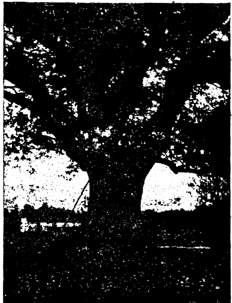
Tamm Pühajärve mõisa pargis.