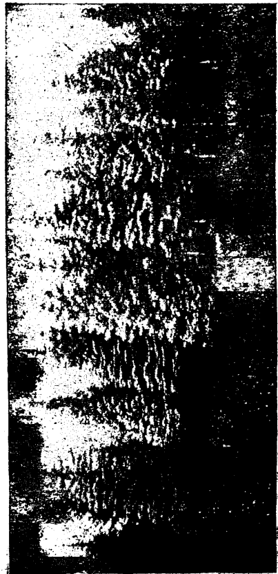
Oksapunde kogu Olustvere mõisa pargis