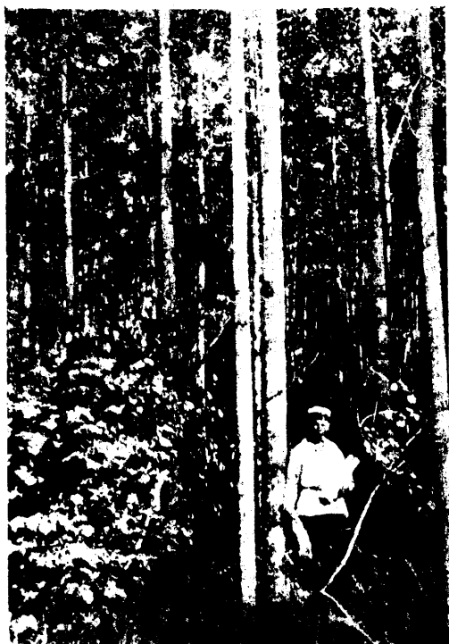
30. aastane haavistu, Rahtwa metsanditus, Drawa metsasõnnas, wigastatud Saperda carcharias L. poolt.

Meerandis on siin haruldaselt lopsakas heintaimede kasv.