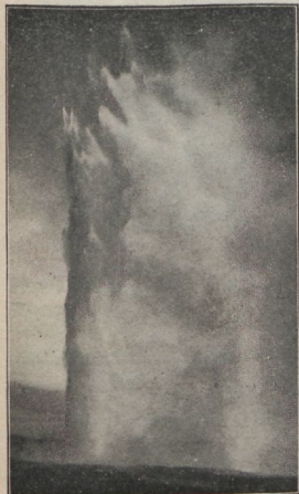
Suurim keeva vee heiser, ligi 70 meetrit kõrge.

Island, mida nimetatakse muinasjuttude saareks, on tühi märgine maa. Ilma metsata, ilma rõõvloomadeta, ja vaevalt leidub muid kasve kui rohi. Vaid suured laavamäed,