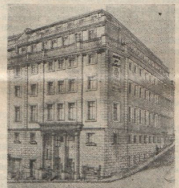
Genfis, Schveitsis avatud nua naiste-kodu.

Haigusepisalased ei edene inimese soontes, kes teeb harjumiseks süüa sibulaid. Sibulasõõjal on väga harva erguvalu. Vähe on inimesi, kes oleksid parestal hambad kui itaalu merimeestel, kes sõivad liunaks kivi-va liba ja toores sibul. Toores sibul, lisatuna katarri padevate isikute tõidule, on väärtsilik, ja infu-entsia ei pääse kergesti ligi inimesele, kes sööb iga päev ühe sibula.