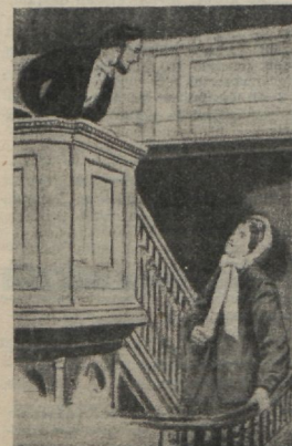
William Booth lubab oma abikaasat jutlustada.

Mida Katarina sel ajal saavutas, on otseselt uskumatu. Teenistuse kõrvale kogudusosad oli tal raskusi ka kodus, sest lapsed olid kõhatades ja tegid palju müret emale. Pealegi oli Katarina ameti jutustajana varsti nii levinud, et ta sai kõikjal kutsed ja pidi palju jutlustama väljaspool. Ta tegi seda rõõmuga, kurtsi ainult, et on vähe aega ettevalmistamiseks. Aga Katarina oli ka hää perenaine. Ta ei salinud raskemist, kuid hoidus ka ihnast kokkukohust. Tema lapsed olid hästi toidetud ja soojalt ning hästi riietatud, ka hariduse ja kasvatuse eest hoolditas ta nii palju kui võimalik. Tundus, nagu oleks ta almanud, et tema lapsed seivavad kord vürstide ja valitsejate ees. (Järg 4. v.)