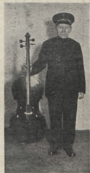
Vend Vichman ühes omavalimis- tatud tshehloja.

Vaadake, mida väike sõna Jeesu- selt võib teha! See aitab väikest