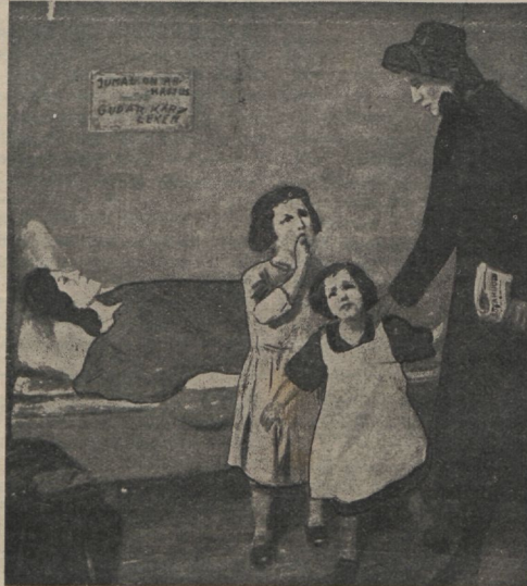
„Ema magab nii kaua... ema külmatab, ta käed on nii külmad.“