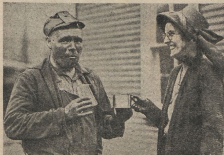
Vaimus aittama, kus abi tarvis.

Ehitaja, kes ehitab maju; mees, kes hoolitseb hobuste eest; pois, kes puhastab saapaid; kontoritööline, kes töötab oma raamatute juures; põllutööline, kes harib maad ja hoolitseb loomade eest — kui nad on teinud seda ustaval südamega, mis pestud Talle veres ja on täis armastust oma õpetaja ja kaasinimese vastu, siis nad sama kindlasti lähevad Jeesuse Kristuse — puusepa — kunnertliki, ja nende koht on sama ligidal troonil kui sellel mehel, kes on kuulutatud tuhandele armuõpetust või valitsenud tervele kuningriikide üle.