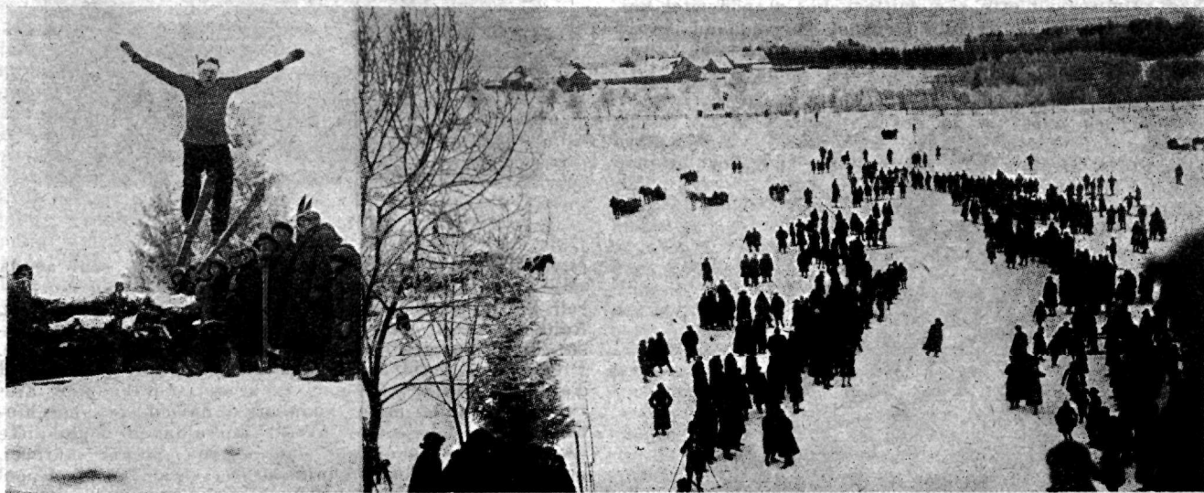
Ilusa suusahüppe sooritab Rakvere maleolane Lille. Paremalt panoraam hüppemäelt.

Eesti kaitseliitlaste-suusatajate tagajärjed 25 klm. suusatajates olid järgmised: 1) Reinhold Niilov (Nar-