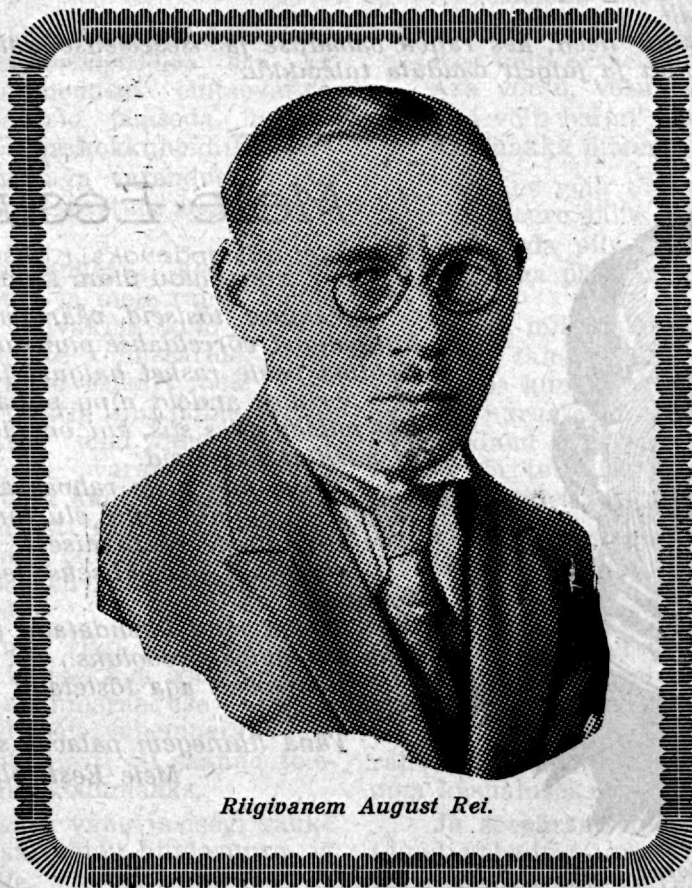
Riigivanem August Rei.