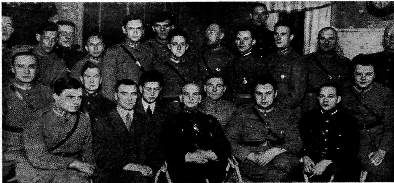
Tallinna maleva 1. malevkonna pealikutekogu.