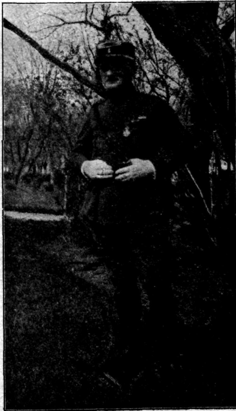
Major Louis Bonne.

tagajärjel ta novembris 1908 a. Prantsusmaale tagasi saadetakse ning määratakse peale haava paranemist 8. koloniaaljalav. rügementi Toulon'i.