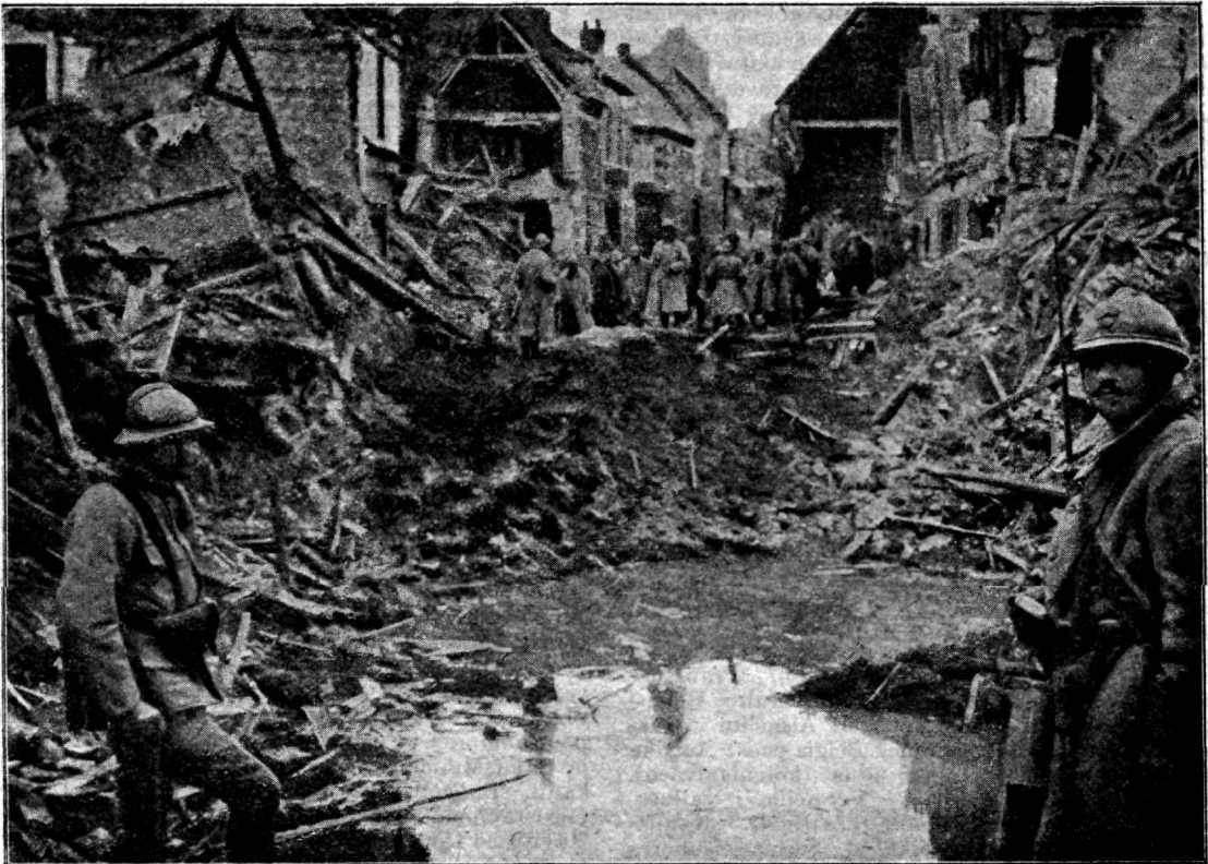
„L'Album de la Guerre'ist“, 4 korda vähendatud.

Lehitsedes aga „Suure Sõja albumi“ restaureeruvad need elamused ja mälestused. Ja selgemalt kui elasime nad üle omal ajal. See on ka loomulik, sest altra sisuga ametlik teadaanne ei suuda ialgi edasi anda lahingu seda iseloomu, mida tõlgitsevad mitmekesised pildistused, maakohtade loetus seda edu või ebaedu, mille selgitab täpne lahingukaart, ka pareim kirjeldus ei jäljenda seda muljet, millise jätab tabav ülesvõte.