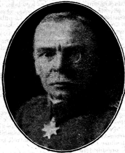
Kindral-oberst von Seeckt.

Hans von Seeckt sündis 22. IV. 1866. Schleswigis pärastise 5. armee korpuse ülema pojana. Tema isa oli keiser Alexandri kaardi rügemendi ohvitserina Preisi-Prantsuse sõjas pataljoni ülemana „le Bourget“, Pariisi eeslinna verisemast lahingust osa võtnud ja