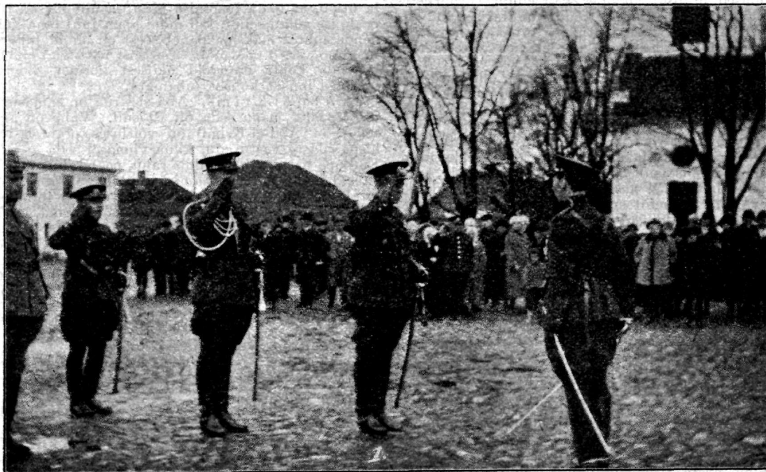
Paraad. Garnisoni ülem kolonel K r u u s (1) võtab paraadi vastu.

1-sel mail 1919 aastal ühendati Ülemjuhataja korraldusel Rõuge, Haanja, Suure-Munamäe ja Nursi ümb-