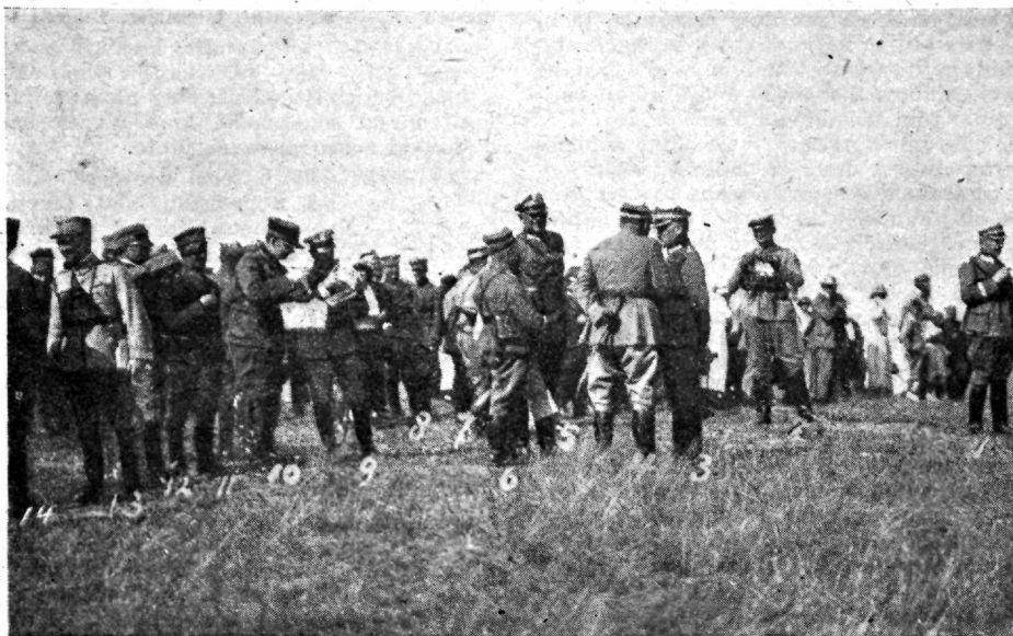
1) Manöövrite juhataja, VII korp. ring. ülem div. kindral Rashevski; 2) VII korpuse ring. ül. adjutant leitn. Lechovski; 3) Kindralstaabi ülem div. kindral S. Haller; 4) Ratsaväe peainspektor kindral Rasvadovski; 5) III armee juhataja kindral Scheptitzki; 6) II korpuse ring. ülem div. kindral Romer; 7) Rootsi sõjaväe attashee kolonel-ltn. Arbin; 8) Tšehoslovakkia sõjav. attashee kindral-major Holy; 9) VII korpuse ring. staabi ülem kolonel-ltn. Vojtkidevicz; 10) Eesti sõjaväe attashee kolonel-leitn. Jacobsen; 11) Türgi sõjav. missiooni esimees kindral-major Nads Pascha; 12) Itaalia sõjaväe attashee kolonel Ivaldi; 13) Rumeenia sõjav. attashee kolonel Trandafirescu; 14) Prantsuse sõjaväe missiooni esitaja kolonel Forlot.