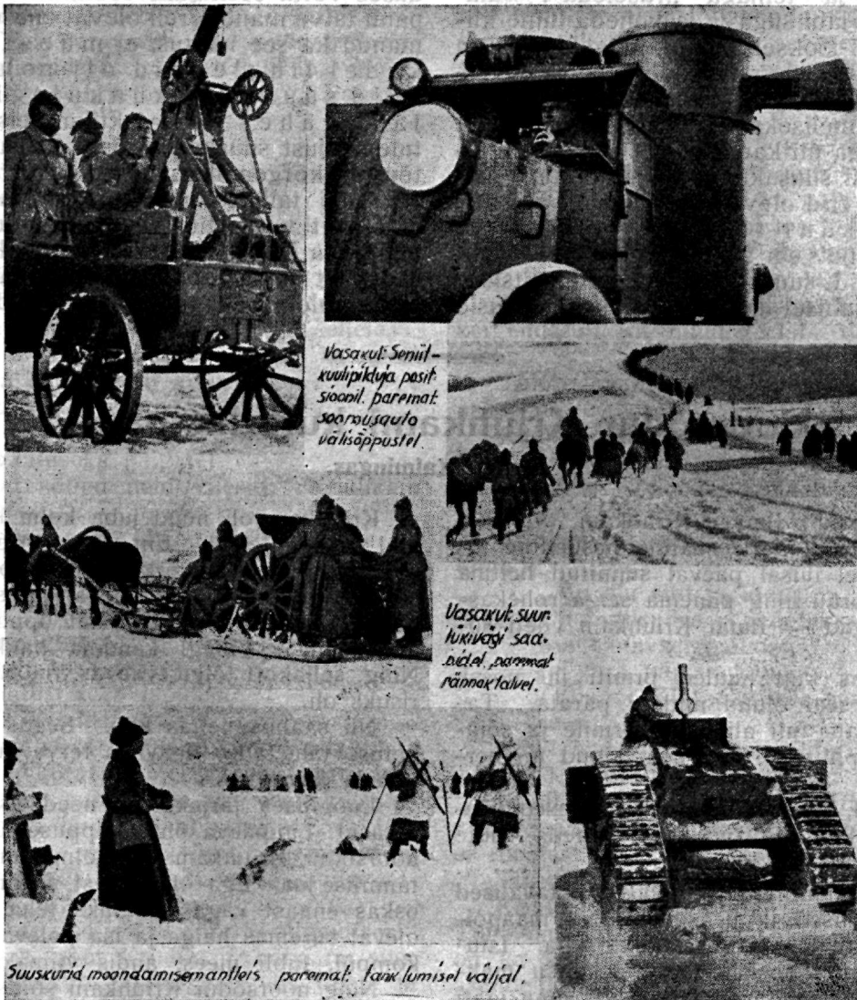
Vasakul: Sõnnikvõllipikkuja positsioonil, paremal: sooritusauto välisõppustel.