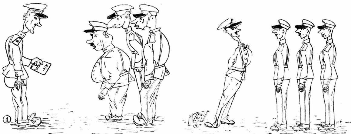
Enne ----- ja pärast rivieeskirjade täitmist.

nistuses kuritegude avastamisel seisab rida eeskujulikke aparate (mikroskoop, stereo- mikroskoop, spektroskoop, ultraviolettkiir- red jne.) ja moodsaid fototehnilisi repro- duseerimis- ja suurendusmeetodeid.