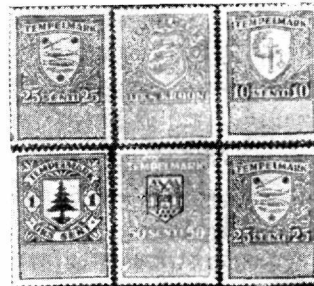
Foto 1. on tehtud harilikus valguses: margid on puhtad. Kuna markide teine külg oli võltsija poolt värskest kaetud liimikorruga, siis ei äratanud margid mingit kahtlust.

Ekspertiisi toimetamisel ilmsikstulnud asjaolusid näitavad meile alljärgnevad fotogrammid: