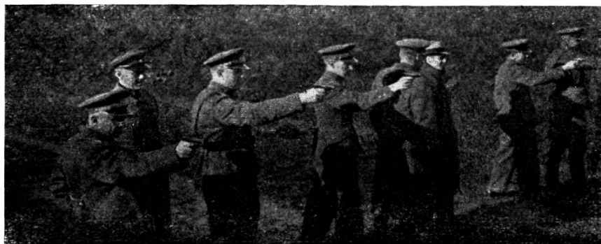
Tartu politseiametnike laskevõistlustelt pistolitest.