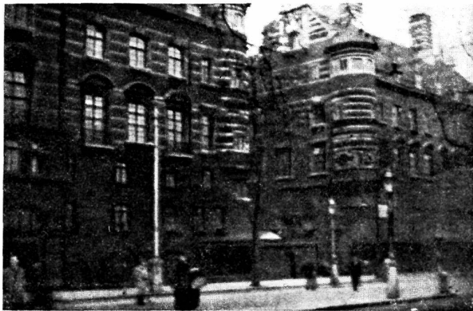
Vaade New Scotland Yardi hoonetele.

Kõigepealt ei teadnud arvata, et ka Inglise elliitkriminaalpolitseil tuleb töötada kitsais