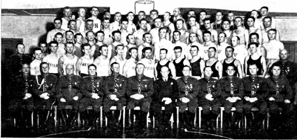
Tallinna-Harju Prefektuuri politseiüksuste-vaheliste võistluste võrk- ja korvpallimängude avavõistlustest osavõtjaid.

raske jõustikus — kursused ja omavahelised võistlused maadluses, poksis ja tõstmises;