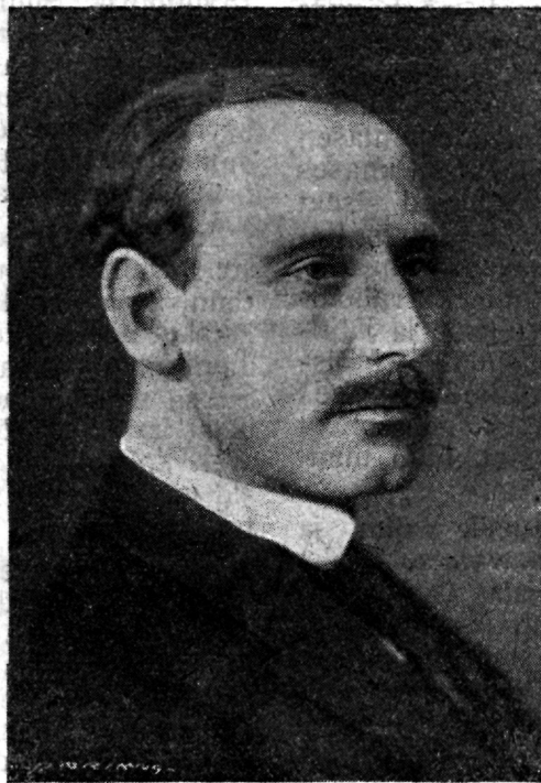
Siseminister K. Einbund.

14) P. p. 12 ja 13 tähendatud toimingute üle tehakse warustust saajate isikute raamatus, lahkunud ametniku arwel, märkused asjade tagasi-saamise ehk raha äramaksmise kohta. (Järgneb.)