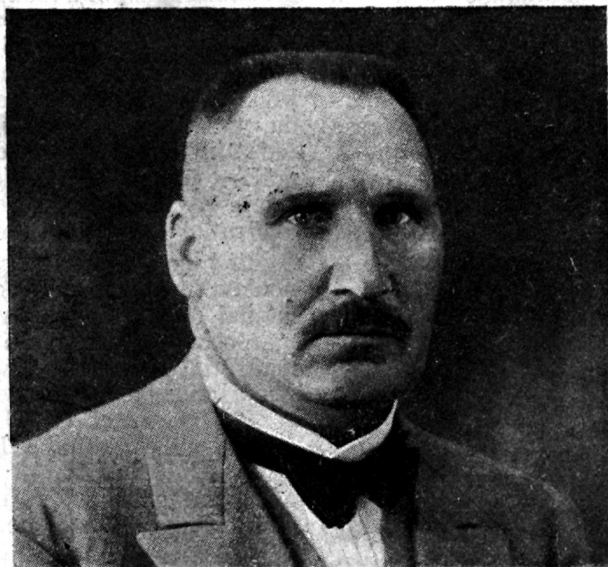
[Riigivanem J. Jaakson.

Sisu: 1) P. Koifin, Kswatsetaw arwepidamine warustuse arwestamise alal politseiasutustes. 2) M. Morrison, Politseikorraldused okupatsiooni ajal. 3) Wõõra riigi kodanikud Greeka- maal. 4) E. Engelbrecht, Kuritegijate warjunimed. 5) Ametlik osa. 6) Wäljamaalt. 7) Küsimused ja kostmised. 8) Kuulutused.