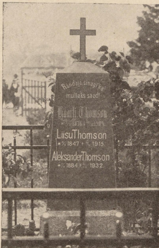
Matmisaik Kullamaa surnuaial.