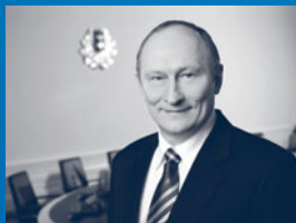
JAAK AAVIKSOO, kaitseminister