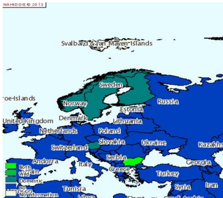
Joonis 2. Euroopa riigid, kus NH vastane vaktsineerimine on keelatud (OIE 2013b)

Laialdaselt kasutatav vaktsineerimine ei välista siiski taudi levikut, sest NH puhangud võivad tekkida ka vaktsineeritud linnukarjades. Nii registreeriti NH 2010. aastal Prantsusmaal lihatuvidel. Varem on vaktsineerivates Euroopa riikides puhanguid esinenud Hollandis aastail 1992–1993, Suurbritannias 1997. a (Alexander 2003) ja Türgis aastail 1992–1993 (PPMV-1). Vaktsiini tootmisel kasutatud NH viiruse genotüüp ei mõjuta oluliselt vaktsiini tõhusust. Enamik NH vastu vaktsineerivates riikides tekkinud puhangutest võis olla põhjustatud ebaadekvaatselt vaktsineerimistehnikast või strateegiast (Dortmans jt 2012).