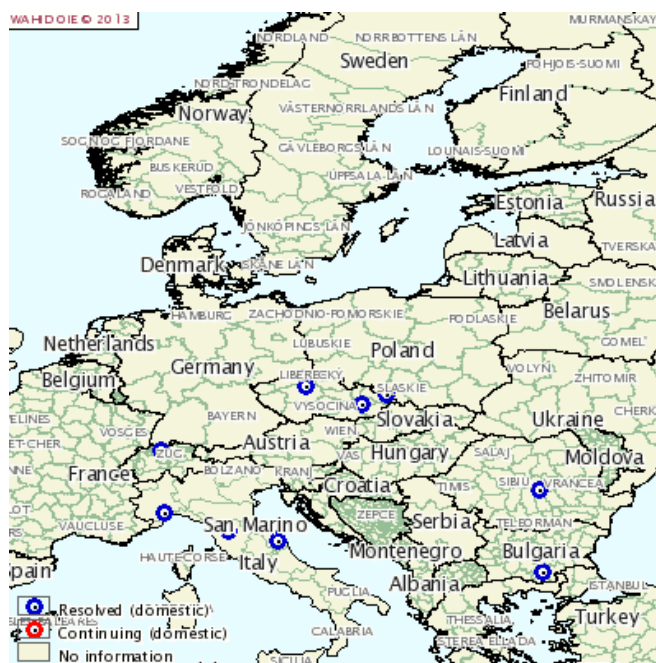
Joonis 1. NH esinemine Euroopas 01.01.2012-10.05.2013 (OIE 2013c)

Paljudes riikides vaktsineeritakse kodulinde profülaktiliselt NH vastu. Samas on ka rida maid, kus kodulindude NH-vastane vaktsineerimine on keelatud. Euroopas olid 2013. aastal sellised riigid Soome, Rootsi, Taani, Norra ja Austria.