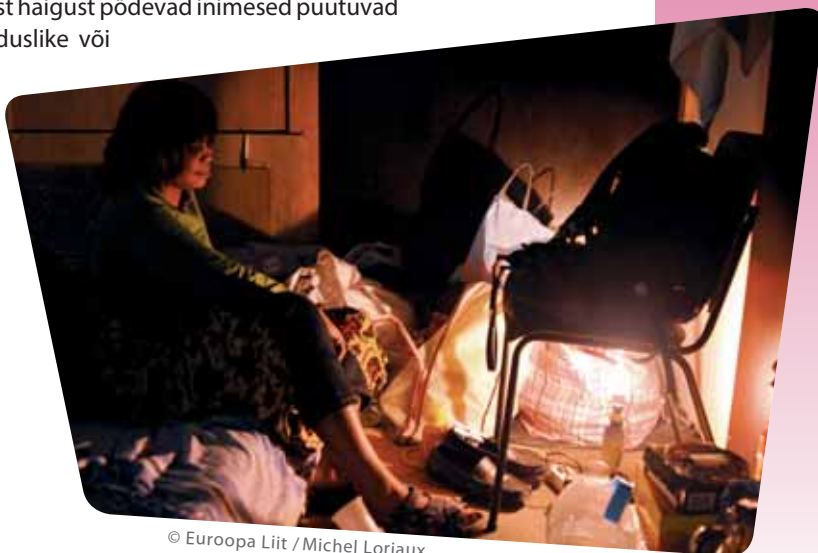
© Euroopa Liit / Michel Loriaux

Puudega või rasket kroonilist haigust põdevad inimesed puutuvad sageli kokku suurte majanduslike või sotsiaalsete raskustega, mis mõjutavad tihti kogu leibkonda, kellest nad sõltuvad. Umbes 6,5 miljonil vaesus- või tõrjutusohus elaval inimesel on mingi puue.