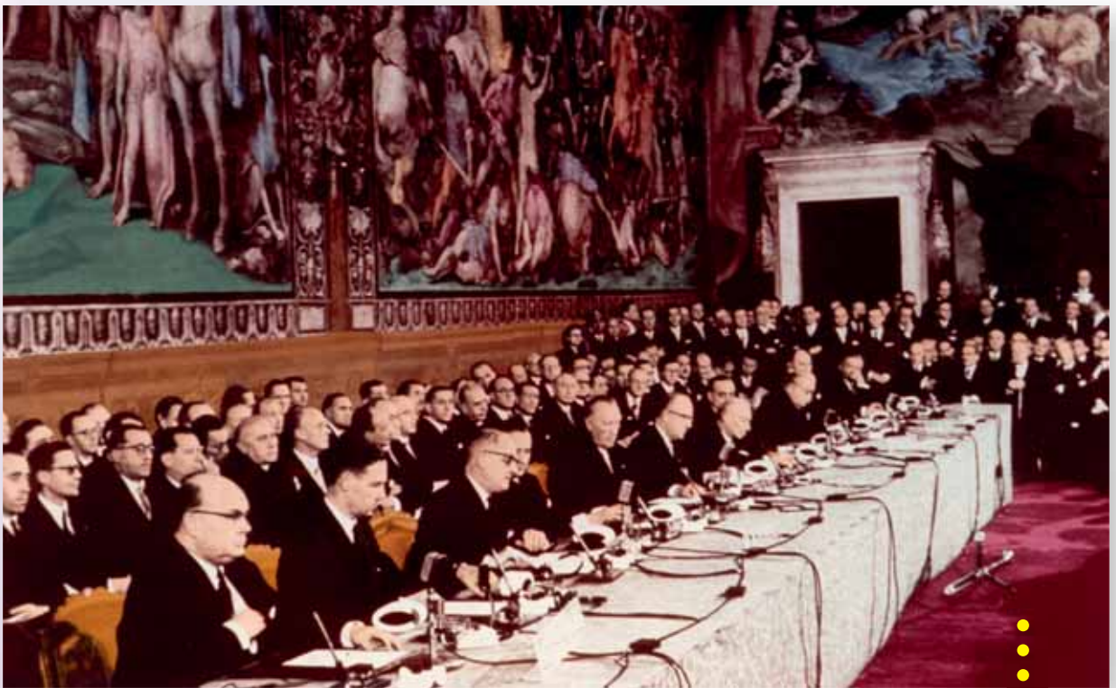
EMÜ ja Euratomi lepingute allkirjastamise tseremoonia (Sala degli Orazi e Curazi, Kapitoorium, Rooma, 25. märts 1957)

Pärast Euroopa kaitseühenduse loomise ebaõnnestumist keskenduti Euroopa ülesehitamisel majandusele. 1.–2. juunil 1955 Messinas toimunud konverentsi järel moodustati Euroopa ühise turu mudeli ettevalmistamiseks komitee, mille eesistujaks sai Belgia välisminister Paul-Henri Spaak. Nimetatud komitee koostas kahe teksti eelnõud, mida tuntakse Rooma lepingute nime all, kuna ESTÜ kuus asutajaliikmesriiki kirjutasid neile alla 25. märtsil 1957 Roomas. Need lepingud jõustusid 1. jaanuaril 1958.