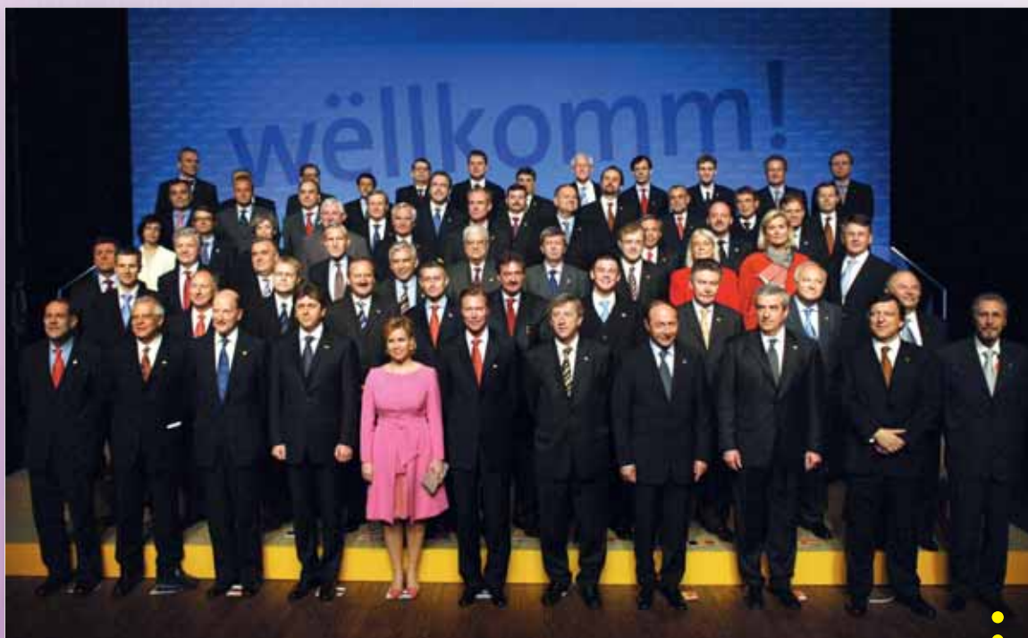
Bulgaaria ja Rumeenia ühinemislepingu allkirjastamine, ühisfoto (Luxembourg, 25. aprill 2005)

Kuna põhiseadusliku lepingu jõustumine ei osutunud võimalikuks, alustati 2007. aastal uute läbirääkimistega, mis viisid Lissaboni lepingu allkirjastamiseni 13. detsembril 2007 ja jõustumiseni 1. detsembril 2009.