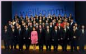
25. aprillil 2005 Luxembourgis Rumeenia ja Bulgaaria ühinemislepingu allkirjastamise tseremoonia