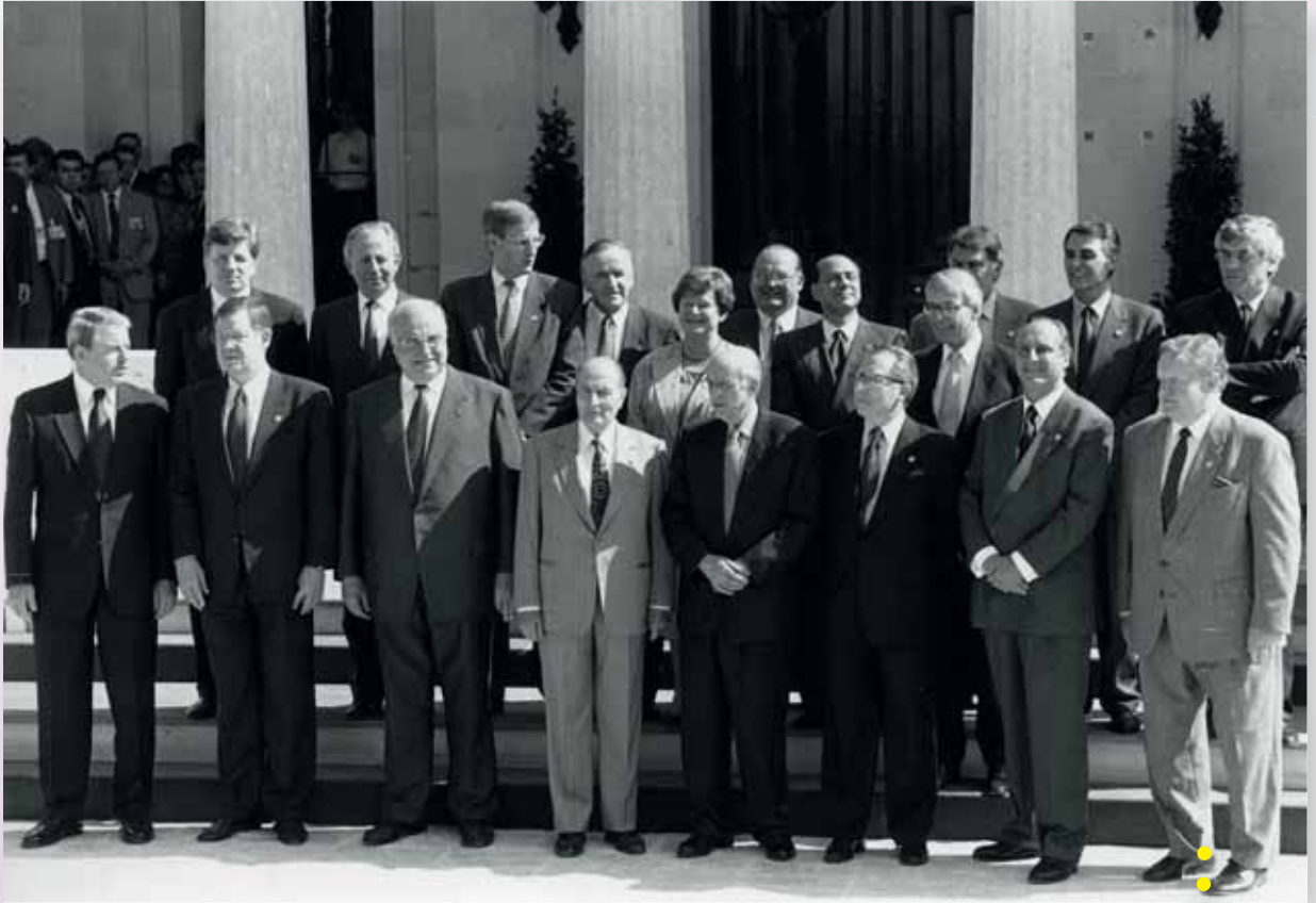
Euroopa Ülemkogu Kérkyra saarel, ühisfoto (24. juuni 1994)

24. juunil 1994 allkirjastati Kérkyra saarel Austria, Soome ja Rootsi ühinemisleping , mis jõustus 1. jaanuaril 1995. Norra, kes oli samuti lepingule alla kirjutanud, loobus 28. novembri 1994. aasta referendumi tulemusel ühinemisprotsessi jätkamisest, nagu oli juhtunud juba 1972. aastal.