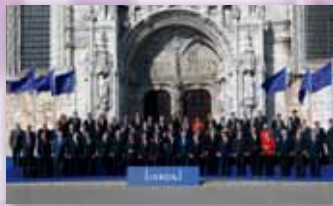
13. detsember 2007 Lissabonis lepingu allkirjastamine