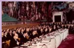
25. märtsil 1957 Roomas EMÜ ja Euratom lepingute allkirjastamise tseremoonia