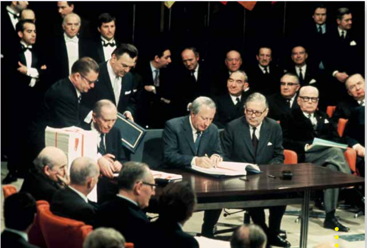
Edward Heath Ühendkuningriigi ühinemislepingut alla kirjutamas (Palais d'Egmont, Brüssel, 22. jaanuar 1972)

Samal perioodil, 22. jaanuaril 1972 kirjutati alla Ühendkuningriigi, Taani ja Iirimaa ühinemislepingule , millega nimetatud riigid ühinesid Euroopa Majandusühenduse ja Euroopa Aatomienergiaühendusega ning mis jõustus 1. jaanuaril 1973. Nõukogu 22. jaanuari 1972. aasta otsusega nähti samuti ette ühinemine ESTÜ asutamislepinguga. Vahepeal tegi Norra pärast 25. septembril 1972 läbi viidud referendumit otsuse ühinemisest loobuda 3 .