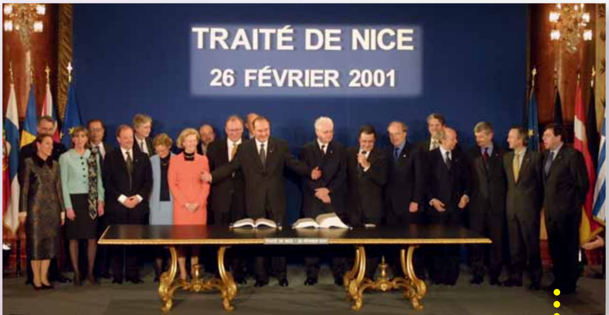
Nice'i lepingu allkirjastamine, ühisfoto (Nice, 26. veebruar 2001)

Amsterdami lepingule lisatud deklaratsioonis kinnitatakse, et institutsioonide „tugevdamine on esimeste ühinemisläbirääkimiste lõpetamise vältimatu tingimus”. Aluslepingute muutmiseks korraldati seetõttu uus valitsustevaheline konverents, kui 1998. aastal alustati ühinemisläbirääkimisi Ida- ja Lõuna-Euroopa kandidaatriikidega. Konverentsi tulemusel allkirjastati 26. veebruaril 2001 Nice'i leping , mis jõustus 1. veebruaril 2003. Sellega muudeti aluslepingute institutsioonilisi sätteid, pidades silmas liidu laienemist 25 liikmeni. Tšehhi Vabariigi, Eesti, Küprose, Läti, Leedu, Ungari, Malta, Poola, Sloveenia ja Slovakkia ühinemisleping allkirjastati 16. aprillil 2003 Ateenas. Leping jõustus 1. mail 2004.