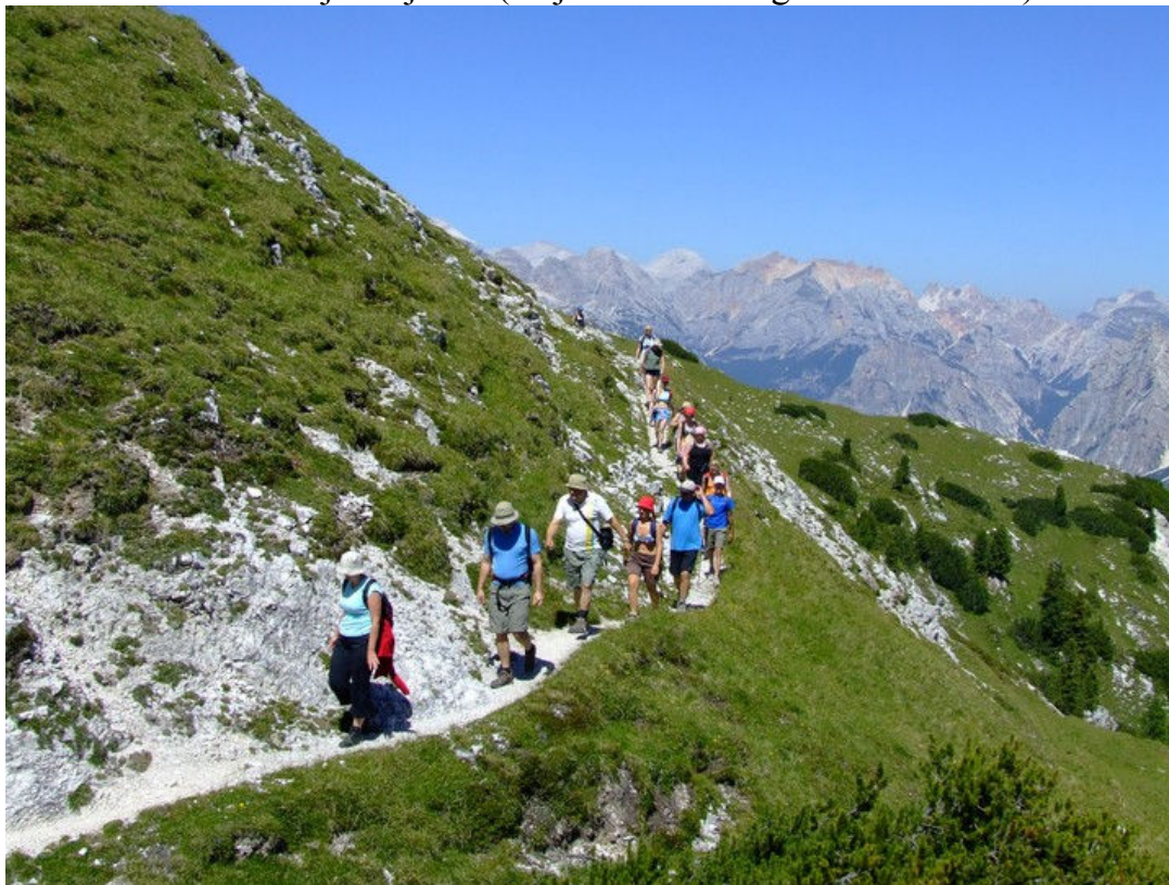
Grupp on kohanemismatkal Tondil

Üheks selliseks piirkonnaks, kus alustada ning õpetada inimestele armastust matkamise ja mägede vastu, on Põhja-Itaalias asuvad Dolomiidid, mis on kuni 3500 m kõrgune mäestikuala Kirde-Itaalias Alpide lõunaosa lubjakivivööndis. Need on tekkinud triiase ajastul merepõhja ladestunud mineraliseerunud korallidest ning kerkisid üles Euroopa ja Aafrika mannerlava kokkupõrkes 60 miljonit aastat tagasi. Siinsete heledate kaljude kallal on enim vaeva näinud jää, päike ja vihm. Üldiselt on Dolomiidid üsna kuivad ja kaljused (kaljuseinad on sageli vertikaalsed).