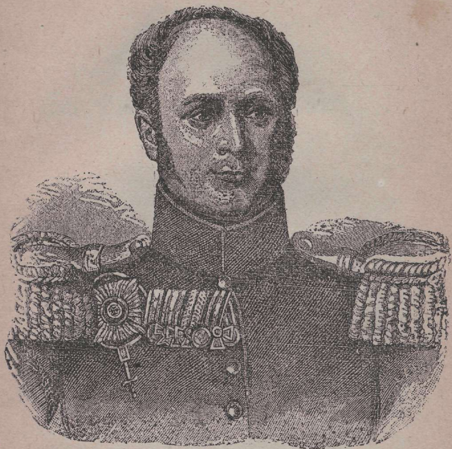
Keiser Aleksander I.