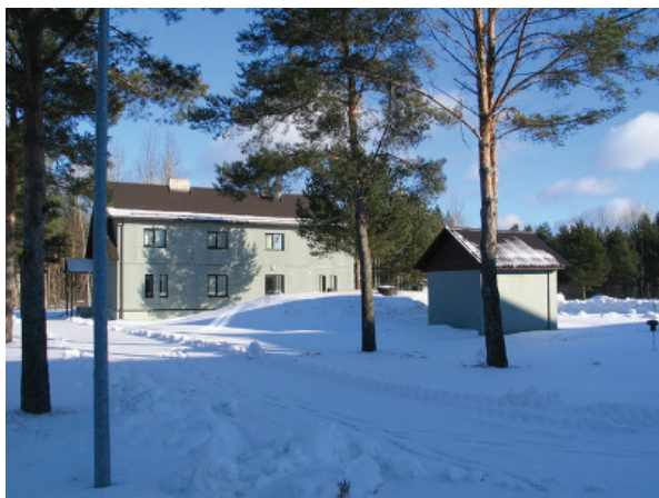
Illuka vastuvõtukeskus talvel

Kõik varjupaigataotlejad majutatakse Illuka Varjupaigataotlejate Vastuvõtukeskusesse. Teil on kohustus elada vastuvõtukeskuses ning viibida seal öisel ajal (kella 22.00-06.00).