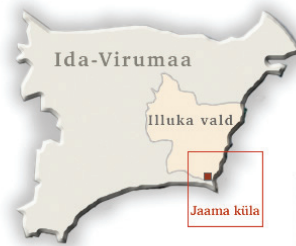
Illuka Varjupaigataotlejate Vastuvõtukeskuse asukoht