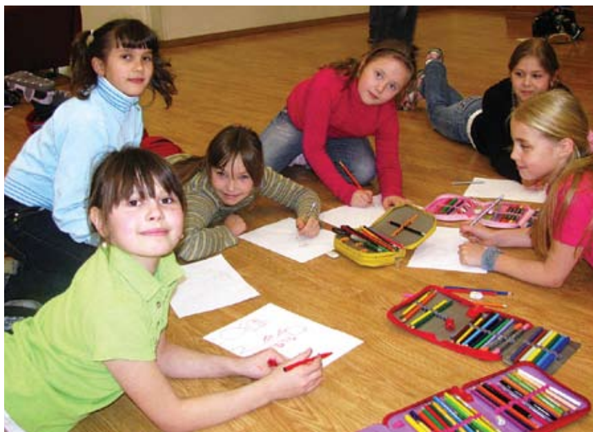
Algklasside tüdrukud numbritest pilte joonistamas

Matemaatika nädala tegevused toimusid nii vahetundides kui ka matemaatika ainetundides kõikides klassides. Ainenädala ettevalmistamises ja läbiviimises osalesid kõik kooli matemaatikaõpetajad.