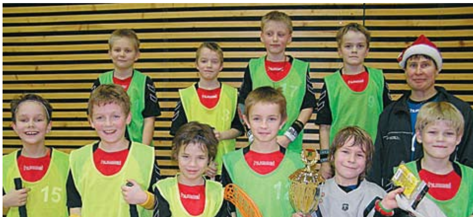
Võidukas Paide-Järva võistkond, pildilt puudub Jarmo Laanetu.