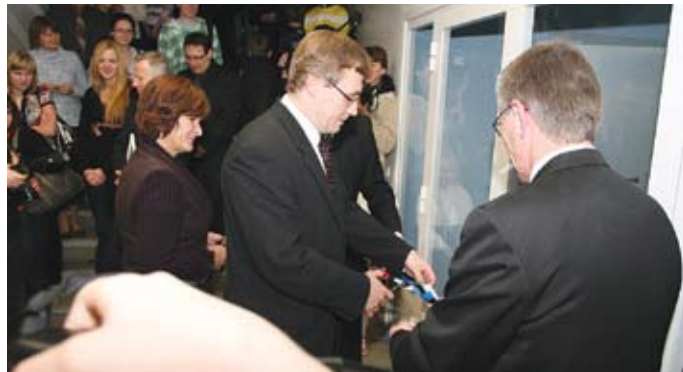
Rekonstrueeritud Paide gümnaasiumi B-korpuse lindi lõikas läbi haridus- ja teadusminister Tõnis Lukas, kelle järel on kord linna- pea Kersti Sarapuu käes.

Paide abilinnapea Kaido Ivaski sõnul on gümnaasiumi B-korpuse rekonstrueerimise järel kapitaalsete remondi läbi teinud kogu 1964. aastal ehitatud koolihoone. „Kooli juurdeehituse korrastas linn 2002. aastal, A-korpuse üle 10 miljoni krooni maksma läinud remonttööd lõppesid 2006. aastal ja kui suvel