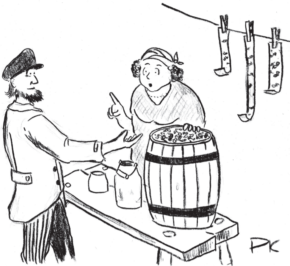
KOHA PRIIDU TSEHKENDÜS

Lavka man olf suur tünn, kuhi pääl lõpnuist kärbläisist. Papa silmä kah tuud ja ütch, et asi ei olõ õigõ. Sis tä tsoksa sörmõga kärbläseunikut nink säält kostõ kõminat. «No mis ma ütli! Tünn om kummalõ pantu ja põha pääl om õnnõ kõrakõnõ lõpnuisi kärbläisi.