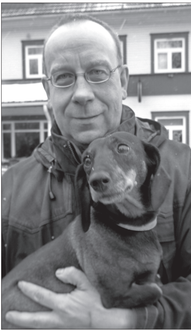
PEEDOSAARÕ KAISA PIILT

Kopra vana võrokiilne nimi om maiai. Seo om pia soomõ keelgele sama – Soomõn kutsutas kobrast majavas . Eestimaaal ja terven Euroopan om kobras