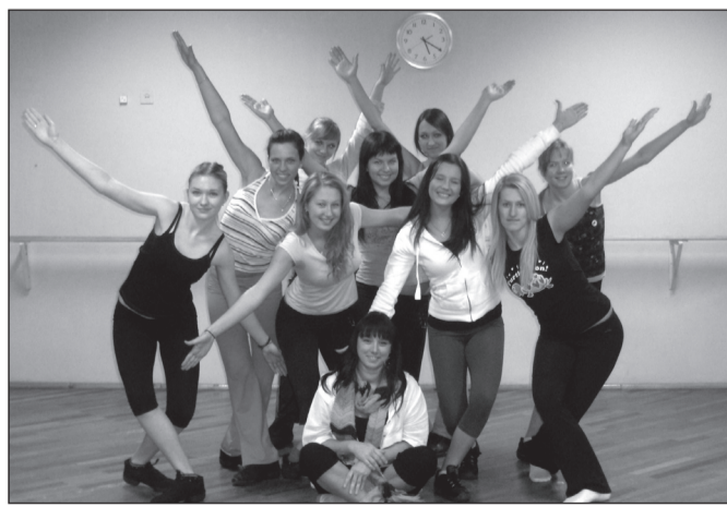
PEEDOSAARÕ KAISA PIILT

Tütrigu omma esinemän käünü üle kõgõ Eestimaa. A kõgõ miildejävamb esineminc