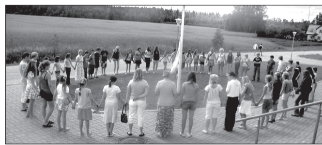
Kümnes latsi folkloorilaagri minevaasta Oravil.