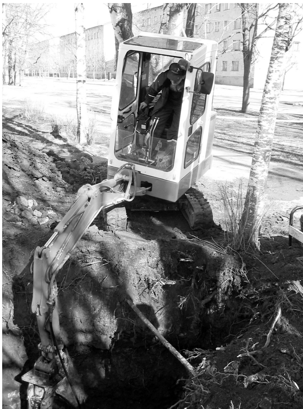
Samasugust pilti saab Elva linna tänavatel näha alates märtsikuust.

Nõo vallas rekonstrueeritakse kaks puurkaev-pumplat, vee- ja kanalisatsioonitorustikke ja ehitatakse uus veetöötusjaam