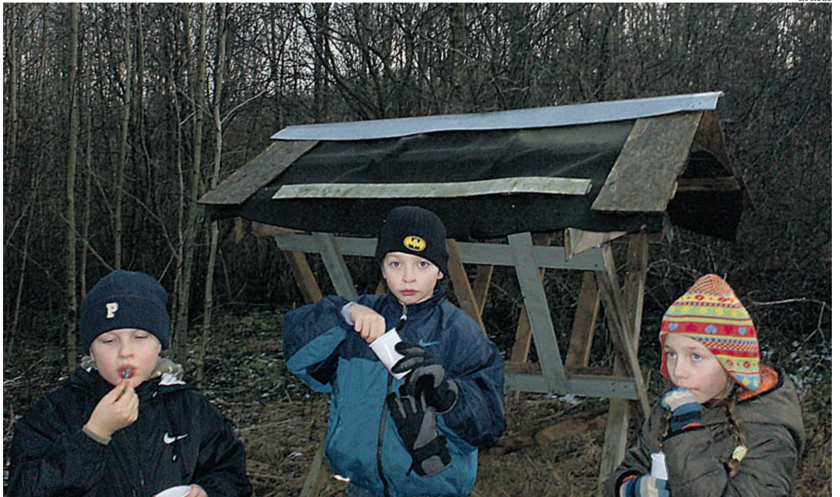
Nigula külaseltsi lapsed loomadele toitu viimas.