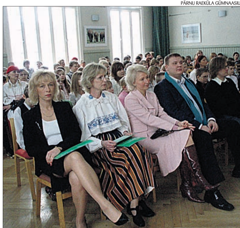
Kristiina Ojuland Pärnu Raeküla Gümnaasiumis.