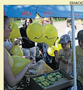
Leisi ettevõtluse päev.