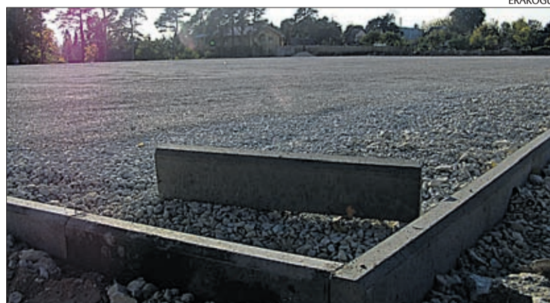
Risti saab peagi staadioni.

Vastab tõele, et terved inimesed on produktiivsemad, vajavad vähem kulutusi sotsiaal- ja tervishoiuteenustele, neil on rohkem võimalusi osa-