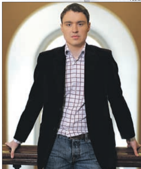
Taavi Rõivas on rahul, et Riigikogu asus liigkasuvõtjaid ohjeldama.

Reformierakondlane Taavi Rõivas ütles Teatajale muutusi selgitades, et justiitsminister Rein Langi algatatud seadusemuudatus on esimene tõsine samm röövellike intressimäärade SMS-laenude piiramiseks. „Kui seni tegutsesit õiguslikus vaakumis, kus kõik oli näiliselt lubatud, siis nüüd