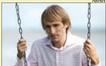
Riigikogu liige Lauri Luik