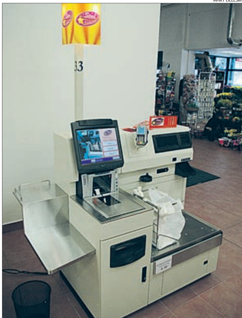
Rõõmu Kaubamaja iseteeninduskassa.