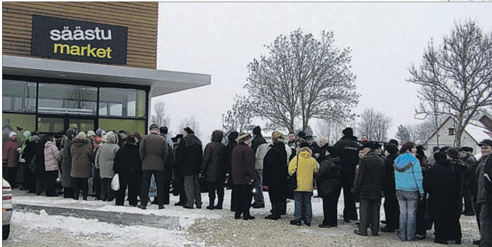
Märjamaal avati kauaoodatud Säästumarket.