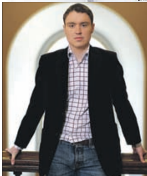
Taavi Rõivas on rahul, et Riigikogu asus liigkasuvõtjaid ohjeldama.

Reformierakondlane Taavi Rõivas ütles Teatajale muutusi selgitades, et justiitsminister Rein Langi algatatud seadusemuudatus on esimene tõsine samm röövellike intressimäärade SMS-laenude piiramiseks. „Kui seni tegutsesit õiguslikus vaakumis, kus kõik oli näiliselt lubatud, siis nüüd