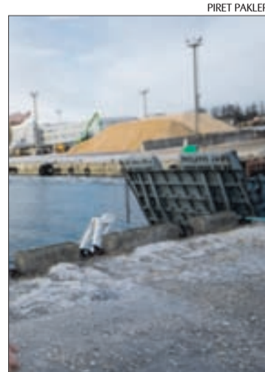
Koht Miiduranna sadamas, kuhu planeeritakse kõrghoone.

Kirjas seisab, et keskkonnaministerium kiitis läinud aasta 27. augustil Miiduranna sadama maa-ala ja lähikinnistute detailplaneeringu keskkonnamoju strateegilise hindamise