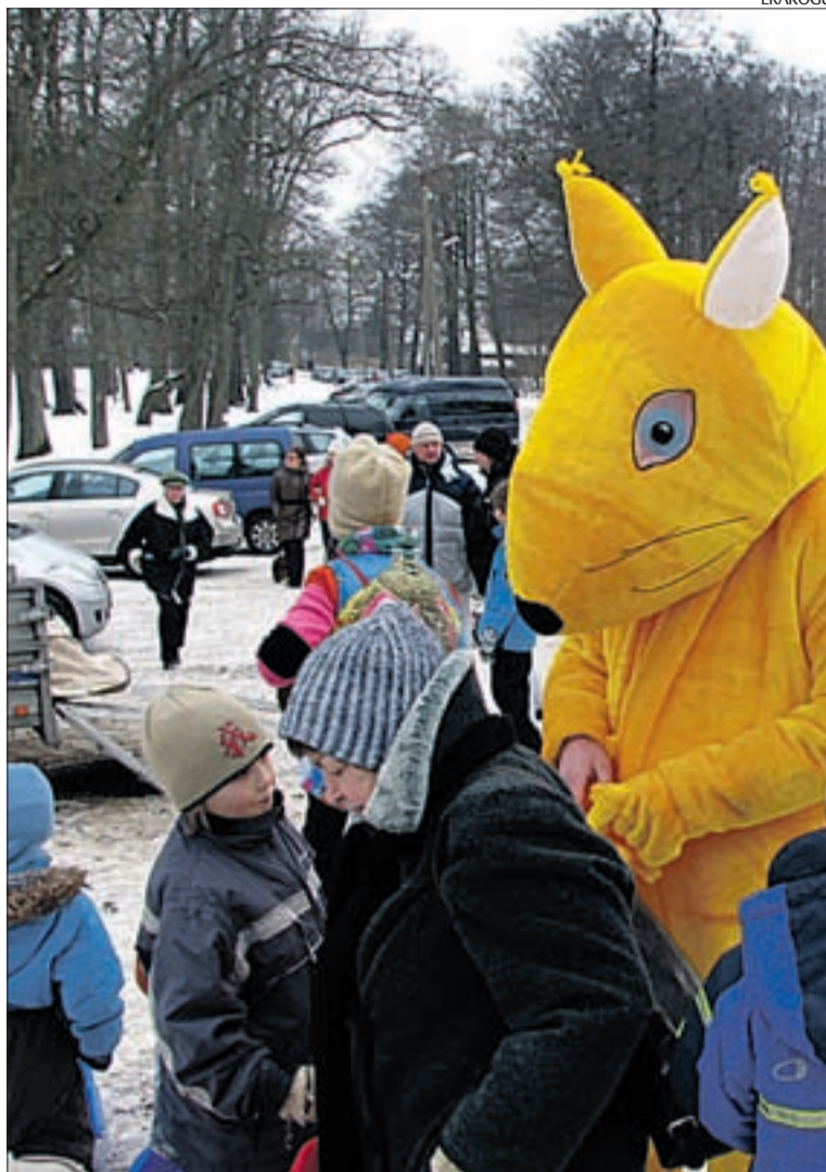
Reformiorav vastlapäeva tähistamisel Viimsis.