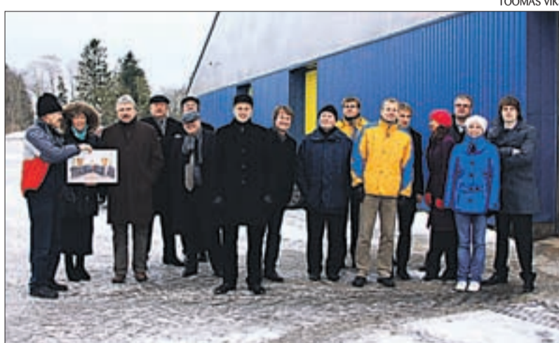
Visiit Harjumaale rõõmustas reformierakondlasi, sest kohtuti positiivselt mõtlevate inimestega.

Järgmine peatuskoht oli AS Paulig, mis on spetsialiseerunud maitseainete tootmisele. Ettevõtte näol on tege-