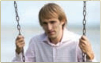
Riigikogu liige Lauri Luik