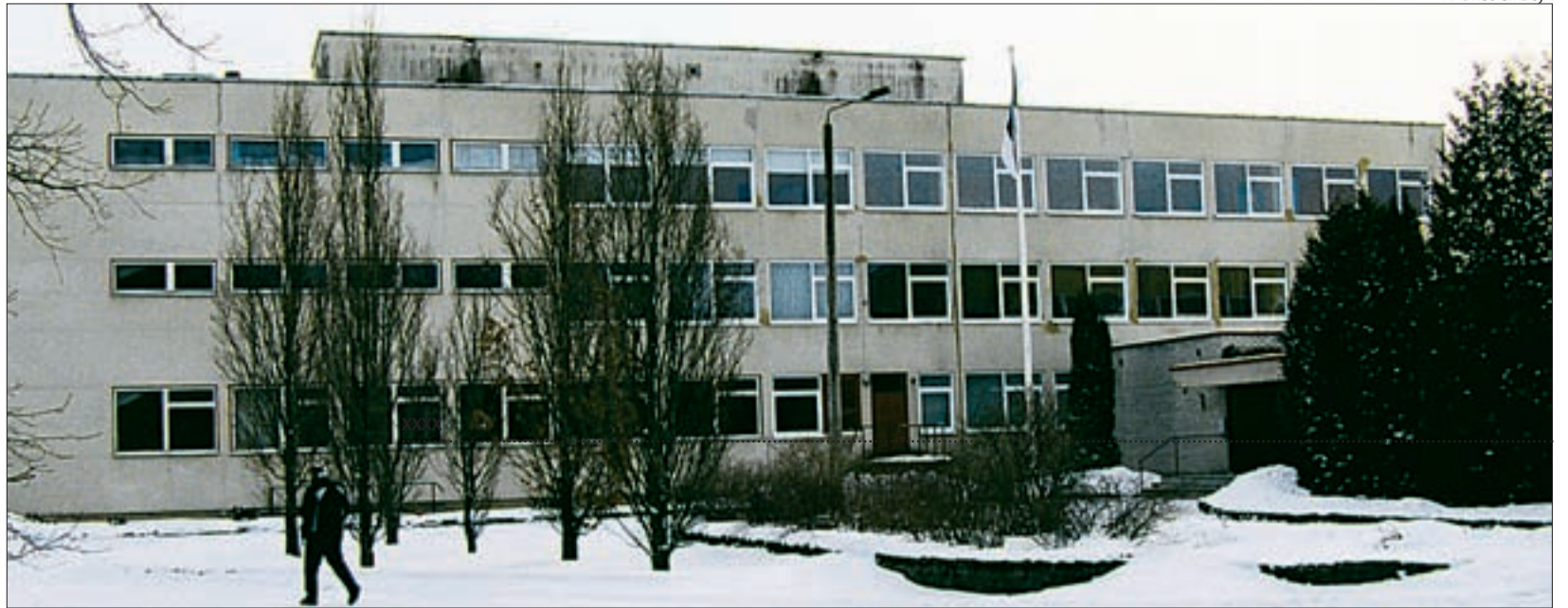
Kostivere Põhikool igatseb remonti.

Keeruliste aegade tähtsaim õppetund on, et need panevad mõtlema, lahendusi otsima. Kerget valikuid enam ei ole. Kaasatriivimise võimalus puudub. Algaval kevadel ja eesootaval suvel tuleb meil kokku hoida nii raha säästmise mõttes, kui üksteisele küünarnukitunnet pakkudes. Siis on lootust, et uuel sügisel oleme üheskoos uuele edule lähemal kui praegu.