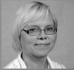
Tea Heinaste Nr 145