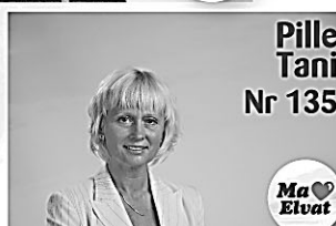
Pille Tani Nr 135