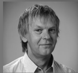
Ain Pedak Nr 151